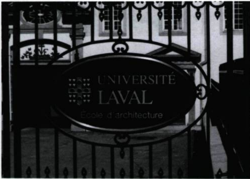
François de Laval, premier évêque de Québec et fondateur du Séminaire de cette ville a laissé son nom en 1852 à la plus ancienne université de langue française en Amérique. (Photo Yves Beauregard, 1993).

à l'intérieur des limites de la réserve faunique des Laurentides au nord de Québec et qui fut concédée en 1965 à l'Université Laval aux fins de recherche et d'enseignement en sciences forestières. Le lac Montmorency situé dans la réserve faunique des Laurentides, le parc et le boulevard Montmorency à Québec, la rue, le parc et la place Montmorency de la ville de Laval , ainsi que plusieurs noms de rues notamment à Montréal, Hull, Bromont, Granby, Châteauguay, perpétuent la mémoire du fondateur du Séminaire de Québec.