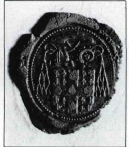
Cachet de François de Laval.