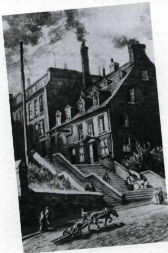
Le site du monument Laval tel qu'il apparaissait avant 1908. Une agglomération de maisons irrégulières occupait l'emplacement. (C.W. Jeffery, 1889. Archives nationales du Canada).

La cérémonie du dévoilement eut lieu le lendemain, 22 juin, à 15 heures. Une messe pontificale avait été célébrée le matin dans la chapelle du Séminaire. Les murs de l'hôtel des postes, du presbytère et de l'archevêché étaient ornés de drapeaux et d'inscriptions, alors que les abords du monument étaient ornés de verdure. Un chœur de 600 voix fut mis à contribution; il exécuta entre autres une Cantate en l'honneur de monseigneur de Laval d'après un texte d'Octave Crémazie. Après l'allocution du président du comité, L.P. Sirois, le gouverneur général du Canada, Lord Grey, procéda au dévoilement en présence d'une foule estimée à 50 000 personnes. François de Laval voyait ainsi son œuvre consacrée par l'histoire. ♦