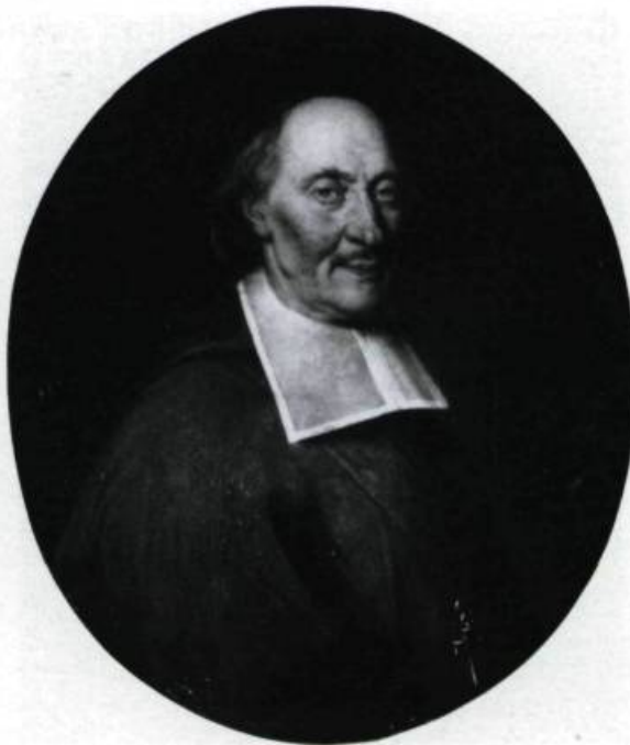
(Fig.2) France, xvii e siècle, huile sur toile, vers 1674. (Collection privée, France).