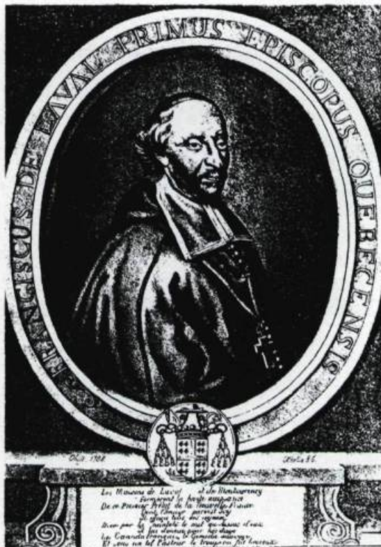
(Fig.6) Gerome Fassio et Napoléon Aubin, lithographie, 1844. (Archives nationales du Canada).

En 1851, Antoine Plamondon (1804-1895) réalise une huile sur toile à la demande du Séminaire de Québec. Puis, en 1870, c'est au tour de Joseph Dynes (1825-1897) de répondre à une commande destinée au Séminaire des Missions Étrangères de Paris. Le tableau resta finalement à Québec.(fig.7) C'est une seconde version, signée et