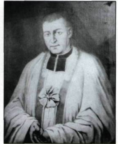
L'abbé Hubert, le populaire curé de la cathédrale, qui disparut tragiquement il y a deux siècles.

Les circonstances tragiques de la mort du curé Hubert bouleversèrent les Québécois. Une complainte, se chantant sur l'air du cantique «Au sang qu'un Dieu va répandre», fut composée par Pierre-Florent Baillairgé et interprétée dans bien des familles de la région jusqu'à la moitié du xix e siècle. Oeuvre de François Sarreau, une autre complainte fut aussi publiée en 1792 par La Gazette de Québec .