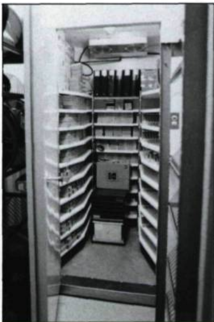
Chambre forte des microfilms, 6 avril 1989.

G.N.: Nous sommes un milieu de stage. L'université Laval nous envoie des stagiaires. Le Conseil canadien des archives offre des bourses de formation et de perfectionnement qui nous amènent aussi d'autres stagiaires.