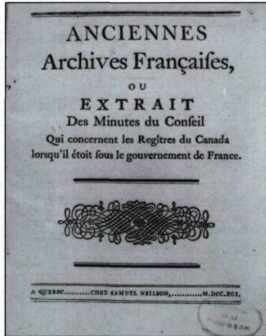
Page couverture du Rapport Dorchester . (Samuel Neilson, éditeur. Archives nationales du Québec à Québec).

Rappelons enfin que la publication de ce rapport et des recommandations qu'il contient marque aussi une évolution du concept même d'archives. D'abord «titres de tous les particuliers» nécessaires à la sécurité publique, Hocquart déplore leur dispersion dans les maisons particulières, plus sujettes aux dangers du feu. Peu après, on ne s'intéresse qu'à la conservation des archives qui peuvent faciliter la gouverne du pays. Avec le Rapport Dorchester une autre préoccupation surgit, celle de leur arrangement