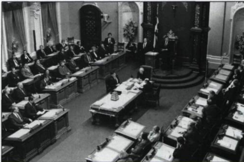
Ouverture de la 34 e législature, le 28 novembre 1989. Le secrétaire général et les deux secrétaires adjoints siègent à la table centrale. Le chef des pages se tient à la droite du Président. (Photographie: Daniel Lessard. Archives de l'Assemblée nationale du Québec).

Le secrétaire général est assisté de deux adjoints qui, en Chambre, prennent place à la table. Ils assistent le secrétaire général dans ses fonctions de premier conseiller parlementaire. Ils s'occupent de la préparation et de la publication du Feuilleton et du Procès-verbal . Ils supervisent les votes par appel nominal et le chronométrage du temps consacré aux orateurs. Ils sont responsables de la Direction de la recherche en procédure parlementaire et de la Direction du Secrétariat de l'Assemblée.