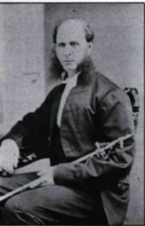
Charles Garneau, pre-mier sergent d'armes (1 er octobre 1867-31 mai 1875). (Archives nationales du Québec à Québec).

Depuis 1985, le sergent d'armes adjoint super-vise le travail effectué par les pages qui servent de messagers aux parlementaires pendant les sessions. La fonction de page serait apparue sous l'Union, vers 1841, et, contrairement à la plupart des fonctions parlementaires, dont celle de sergent d'armes, elle serait d'inspiration amé-ricaine.