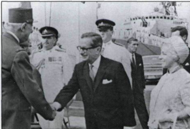
Le 23 juillet 1967, le général de Gaulle et son épouse Yvonne arrivent à l'Anse-au-Foulon à bord du croiseur Colbert. Le premier ministre Daniel Johnson accueille le président au nom des Québécois.

L'histoire se répète à Montréal. Ce 26 juillet 1967, Charles de Gaulle ébranle le Québec tout entier. Du balcon de l'Hôtel de Ville, il