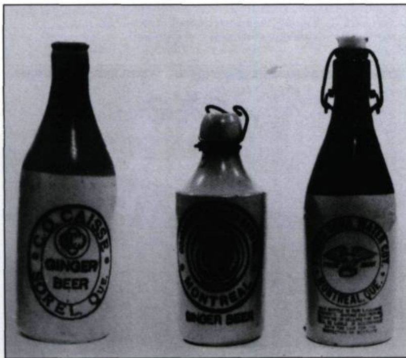
Différents modèles de bouteilles contenant de la bière de gingembre.