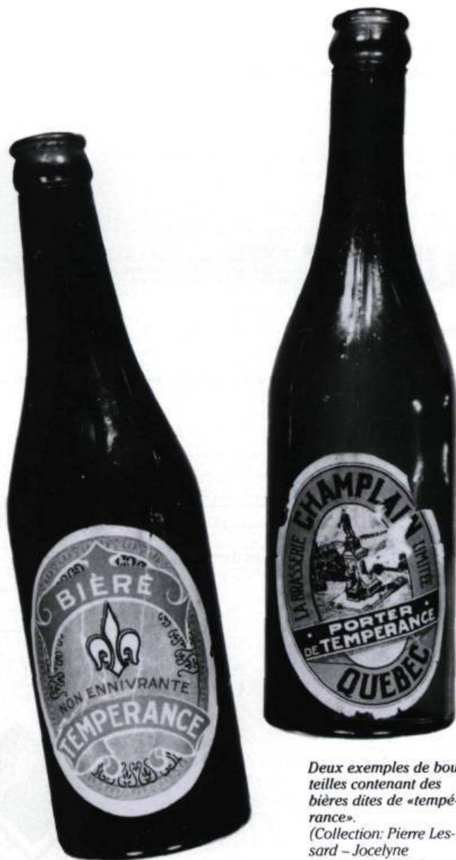
Deux exemples de bouteilles contenant des bières dites de «tempérance». (Collection: Pierre Lesard – Jocelyne Mathieu, Québec).

EST-CE PAR RESPECT POUR LA BIÈRE MALTÉE QUE LES gens du peuple qualifient de «p'tites bières» les autres bières, ou par recours à cette figure de langage par laquelle on qualifie les choses d'inférieures par pudeur de pensée? Nonobstant l'épithète, ces boissons connaissent leur heure de gloire en dehors des périodes strictes de pauvreté, de tempérance ou de non-alcoolisme.