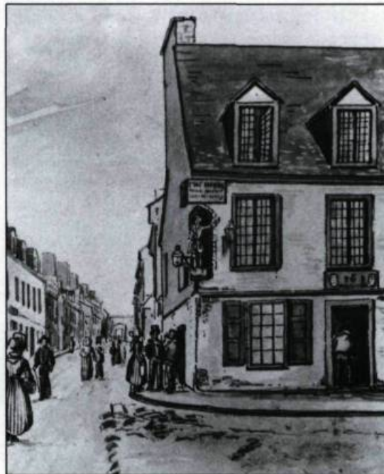
«La rue Saint-Jean vue du coin de la rue du Palais (partie)». Vers 1830, la ville comptait un certain nombre de tavernes dont celle de Joseph Vaillancourt située à la rencontre de ces deux artères achalandées. (Aquarelle de James Pattison Cockburn, mai 1830. Musée royal de l'Ontario).

semble faire partie intégrante d'un certain art de vivre chez les bourgeois, au même titre que la serre, témoin d'une certaine opulence dans la résidence ou encore que le piano-forte qui trône dans la salle de musique. La serre remplie de plantes exotiques et le piano-forte, importé à grands frais de Londres, sont des signes d'appartenance à des groupes sociaux bien dotés matériellement. La cave à vin constitue elle aussi une partie de ces éléments de distinction sociale en milieu urbain. La demeure d'un marchand-négociant, celle d'un membre des professions libérales, ou encore celle d'un haut fonctionnaire colonial, ne saurait exister sans une cave à vin préférablement bien garnie. Dans le milieu des bourgeois de la ville de Québec, le confort