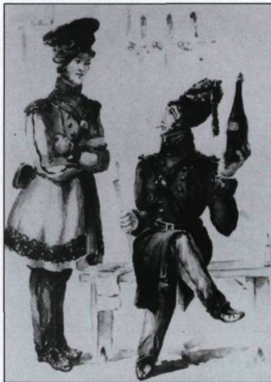
«Soldats de l'infanterie légère à Québec, 1839». La présence d'une garnison de plusieurs centaines de soldats britanniques favorisait aussi le commerce des spiritueux à Québec.

ciétés procèdent aussi à des ventes en gros. Parmi celles-ci, retenons les Lemesurier, Tilstone and Company, Woolsey, Stewart and Company, Reiffenstein and Company, Gillespie and Company, William Price and Company, Heath and Moir, Campbell and Sheppard. Notons que ces encanteurs-courtiers et ces maisons commerciales de Québec, présents dans le secteur des vins et des spiritueux, se révèlent tout aussi actifs dans d'autres sphères économiques de la ville.