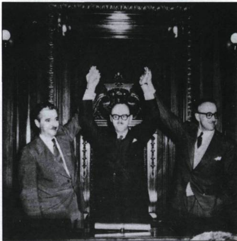
Jean Drapeau, né à Montréal le 18 février 1915. À l'âge de 38 ans, il est élu maire de Montréal en 1954. Il pose ici en compagnie de deux de ses principaux lieutenants, Pierre Desmarais et Pax Plante.

Pour l'instant, l'emprise croissante des associations, institutions et groupes d'intérêts marque la vie politique locale. Ce dynamisme de la «société civile» sert quelques causes progressistes.