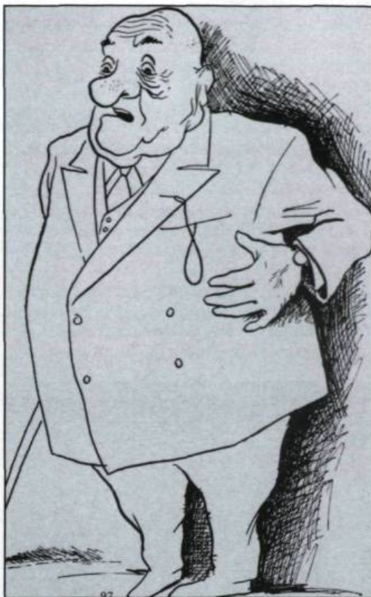
Camillien Houde (1889-1958), est maire de Montréal de 1928 à 1938 et de 1944 à 1950. Député de Montréal-Sainte-Marie à Québec (1922). Il s'oppose à la conscription déguisée en 1939 et est détenu dans un camp d'internement, au Nouveau-Brunswick, jusqu'en 1944, ce qui ne l'empêcha pas d'être réélu maire par 100 000 voix de majorité. (Caricature de Normand Hudon).

Par ailleurs, les difficultés économiques précipitent la faillite de l'administration municipale. Comme toutes les villes de l'époque, Montréal doit gérer les problèmes sociaux engendrés par la crise. L'État-providence n'est pas encore né et les «affaires sociales» relèvent de la municipalité. Les œuvres de charité et l'administration municipale se partagent un fardeau impossible à supporter en ces temps de dépression. Même avec un maire haut en couleur et débonnaire à ses heures, Montréal se sent impuissante à relever pareil défi. Incapable de faire face à ses créanciers, les banquiers réclament et obtiennent la tête de Camillien Houde. 1940: Montréal subit alors une mise en tutelle pendant que son maire calme ses ardeurs nationalistes en prison. Ce purgatoire dure quatre ans. La législature de Québec en profite pour remplacer l'autoritarisme municipal de Montréal par une formule politique tout à fait inédite. Aux conseillers municipaux de classe A (élus par les propriétaires) et de classe B (élus conjointement par les propriétaires et par les locataires) s'ajoute désormais une classe C composée de conseillers non élus mais nommés par onze organismes issus du monde des affaires, du milieu ouvrier, des institutions d'éducation supérieure, du milieu réformiste et des propriétaires. Téléphore-Damien Bouchard, alors ministre des Affaires municipales dans le cabinet Godbout, qualifie