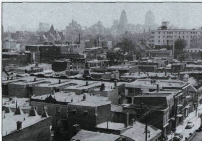
Une partie de la ville de Montréal avec, au premier plan, la rue Dorchester en 1950.

cette mesure de «démocratie tempérée par une représentation corporative»!