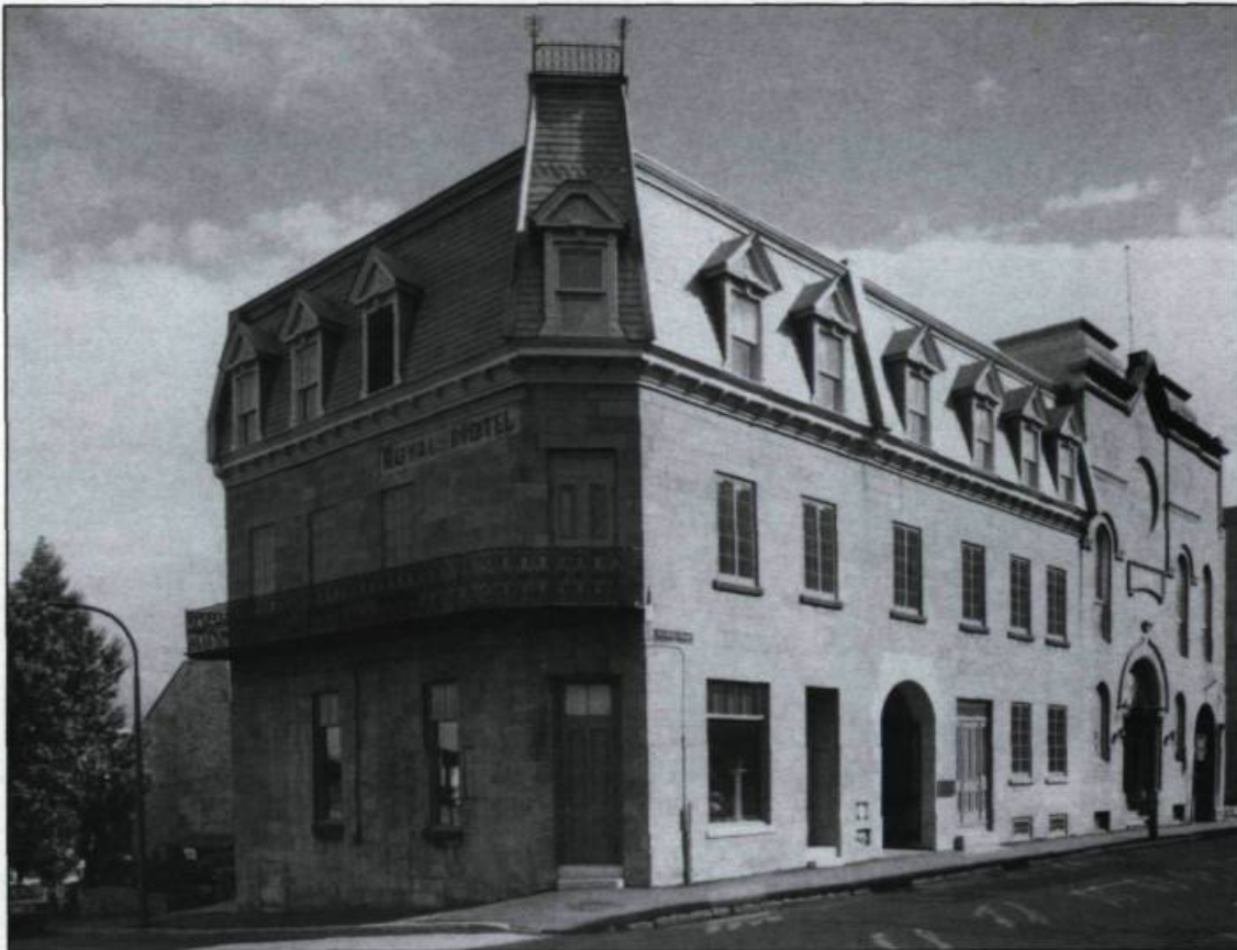
Vue extérieure du lieu historique national de Sir George-Étienne Cartier dans le Vieux-Montréal, à l'angle des rues Notre-Dame et Berri. Le site est composé de deux maisons reliées par un mur mitoyen.