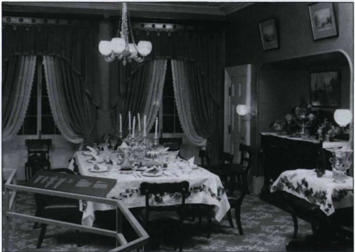
Reconstitution d'une salle à manger du milieu du XIX e siècle.