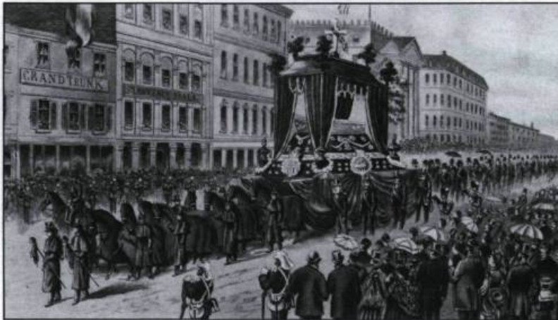
Cette illustration tirée de L'Opinion publique montre les imposantes funérailles de George-Étienne Cartier à Montréal en 1873. Ici le cortège se trouve sur la rue Saint-Jacques. (Archives nationales du Canada, C-29693).

Le droit civil du Bas-Canada, largement constitué d'édits et d'ordonnances datant du Régime français, s'accorde mal avec la modernisation de la société. Dans certaines régions, l'application du droit civil britannique rend la situation encore plus confuse. En 1857, en tant que procureur général, Cartier institue une commission pour procéder à une refonte du droit civil. Le projet du code, inspiré du Code Napoléon, est adopté en 1866.