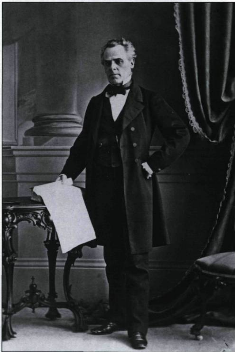
Sir George-Étienne Cartier, né à Saint-Antoine-sur-Richelieu en 1814 et décédé à Londres en 1873.