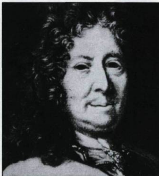
Philippe de Rigaud, marquis de Vaudreuil. Il était gouverneur général de la Nouvelle-France lors de la seconde installation française au Témiscamingue.