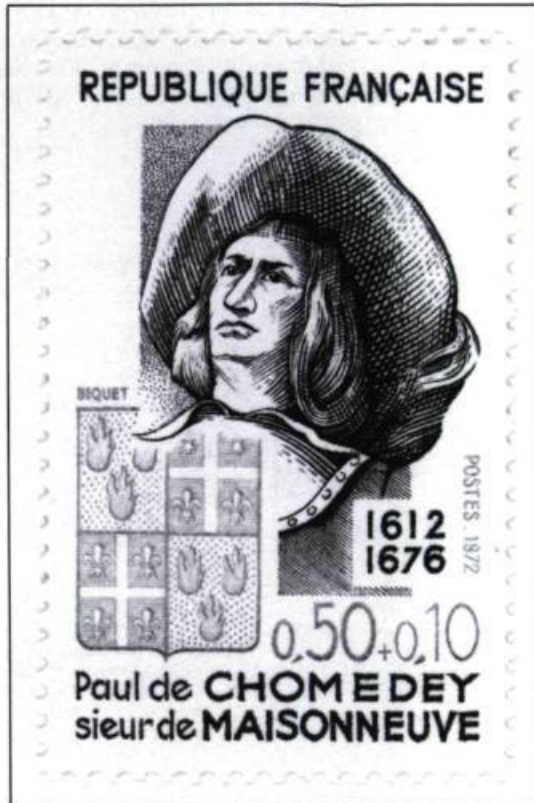
En 1972, la France honorait Paul de Chomedey, sieur de Maisonneuve (1612-1676), fondateur de Montréal.