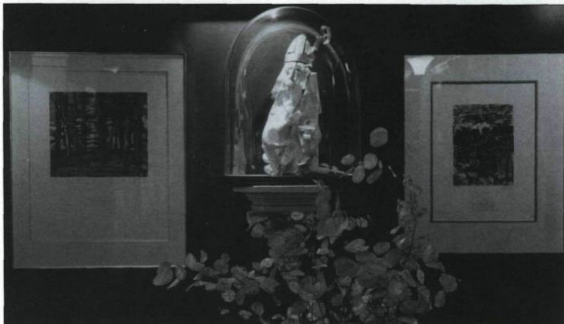
Le saint Gilles en papier Claude Lafortune est encadré par une sérigraphie de Casgrave et une autre de Riopelle. L'édition de ces œuvres d'art à tirage limité constitue l'un des moyens de financement du musée.

Associé au mot muséologie, «écono» prend ainsi une allure nouvelle et acquiert un rôle complémentaire; il désigne non seulement l'objectif fondamental du concept mais il renvoie à des