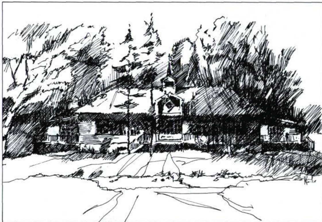
La Papeterie Saint-Gilles, premier laboratoire d'un écomusée en milieu régional. (Dessin de l'auteur).

Toutes ces entreprises-musées et des dizaines d'autres en Hollande, en Suède, en France et ici