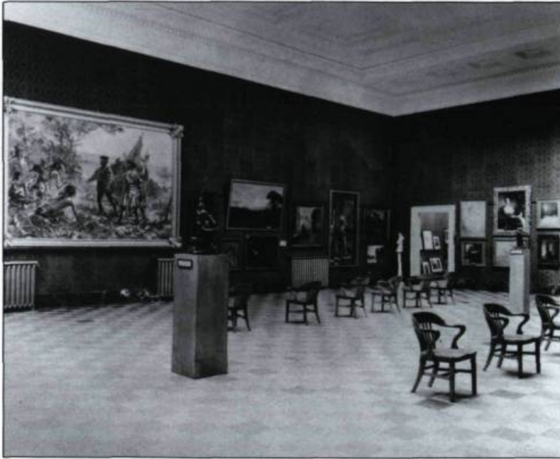
Présentation de toiles dans la première grande salle de peintures (aile sud) préparée par Paul Rainville en novembre 1933. Cette importante section montre les œuvres de Marc-Aurèle de Foy Suzor-Côté.