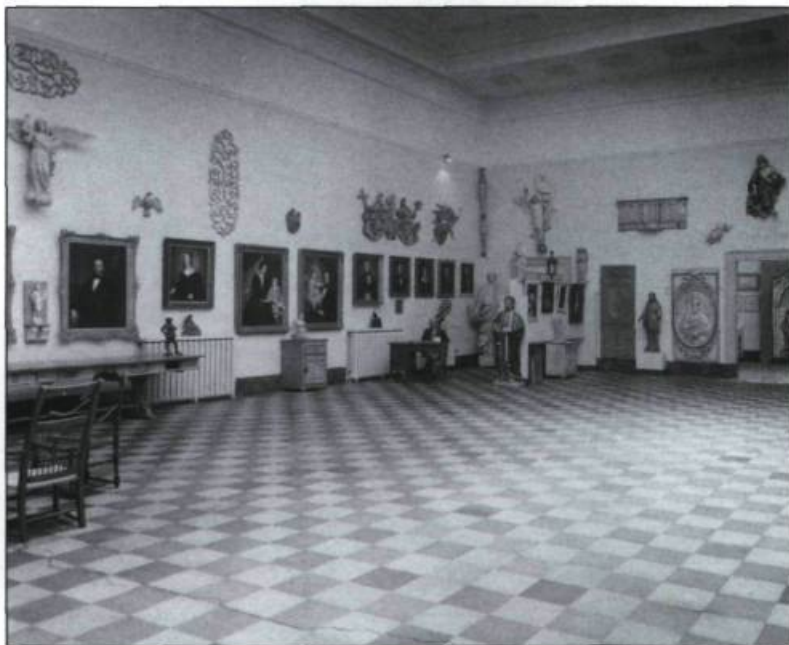
Peintures et sculptures dans la salle Levasseur en 1957. (Archives du ministère des Affaires culturelles, fonds Gérard-Morisset).

arts de Québec et de Montréal, dont les premiers directeurs et enseignants sont des artistes et architectes français. Il est bien probable qu'il ait été encouragé en cela par la pléthore d'artistes québécois formés en France. Mais, dès que ces écoles sont ouvertes, la création d'un musée des beaux-arts s'impose pour que l'État puisse en faire le dépositaire des œuvres qu'il acquiert.