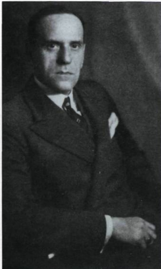
Secrétaire de la province de 1919 à 1936, Athanase David dote la province de Québec d'une panoplie d'institutions culturelles et éducatives laïques en s'inspirant du modèle français. En 1922, il fonde le « Musée du Québec ». (Archives du Musée du Québec).

S'inspirant du modèle français, la politique du gouvernement d'Alexandre Taschereau vise l'implantation du système des beaux-arts. Dès 1920, il entreprend la création des écoles des beaux-