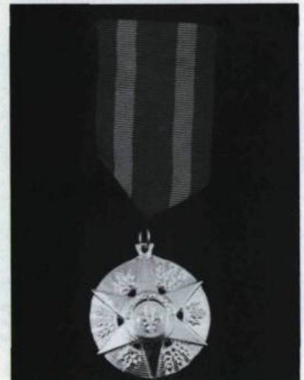
La médaille d'or de l'Ordre du mérite agricole remise en 1889. (Archives de l'Ordre du mérite agricole).

Le concours se tient d'abord sous les auspices du Conseil d'Agriculture, alors présidé par Henri-Gustave Joly de Lotbinière. Le 23 décembre 1890, Charles Champagne, de Saint-Eustache, se mérite la première médaille d'or du Mérite agricole.