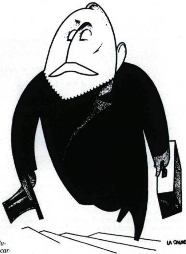
Le diplomate Dandurand à la fin de sa carrière vu par le caricaturiste Robert La Palme en 1937.

L'application de cette prérogative fut confiée au Conseil de la SDN. Toutefois, les minorités n'avaient pas le droit de saisir directement le Conseil et devaient s'en remettre au bon vouloir d'un État tiers pour assumer la tâche odieuse de dénoncer le gouvernement du pays où une minorité s'estimait lésée. Pour le sénateur Dandurand, ce procédé équivalait à une fin de non recevoir des plaintes, et il s'y opposa vigoureusement. La position officielle initiale fut donc assouplie par la création du «Comité des Trois», qui transmettait les plaintes des minorités aux gouvernements visés. Le sénateur siégea sur bon nombre de ces comités, et il y exerça une influence significative. Pour lui, les problèmes des