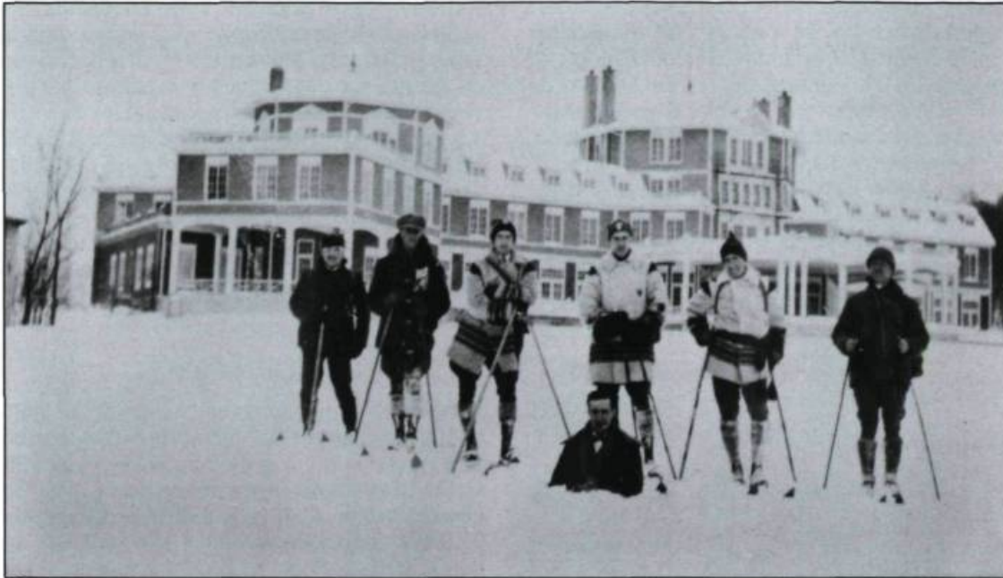
Des skieurs de randonnée devant l'Hôtel du lac Saint-Joseph à l'hiver 1927.