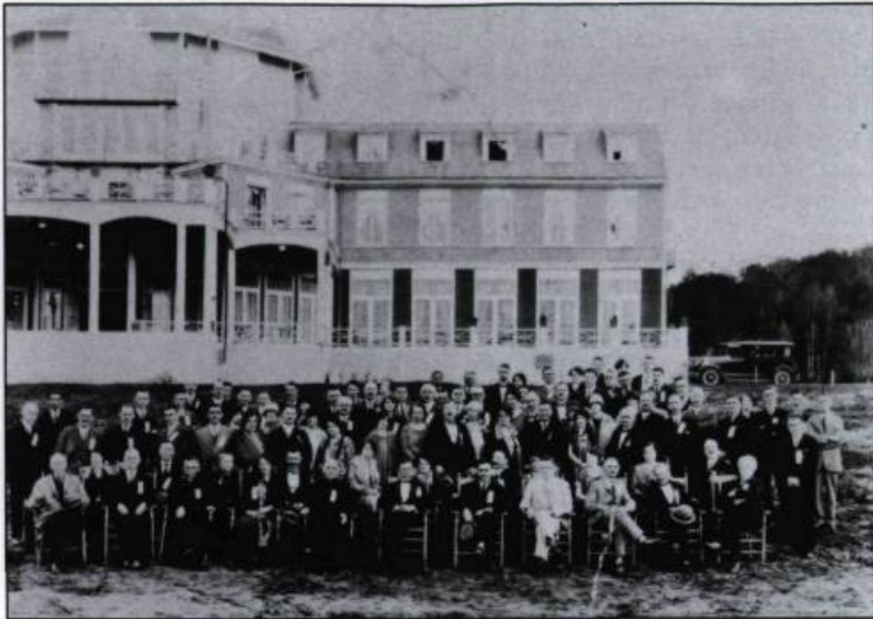
En 1924, l'Hôtel Saint-Joseph accueille des congressistes.

permettre à la population d'assister à la cérémonie.