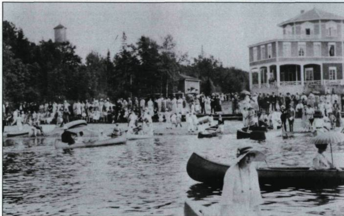
Activités nautiques devant l'Hôtel Saint-Joseph en 1926. (Collection privée).

Par ailleurs, la compagnie de chemin de fer conserve la partie des lots 463, 464 et 465 et les