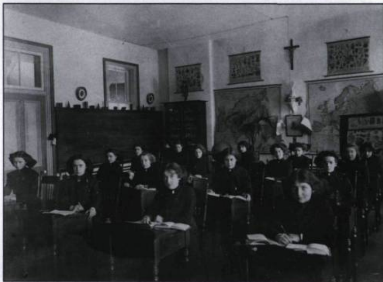
La classe de géographie en 1912. (Archives du collège de Notre-Dame-de-Bellevue).

maison de pierre, granges, étables, remises, bâtiments de ferme, serre chaude, orangerie, jardins».