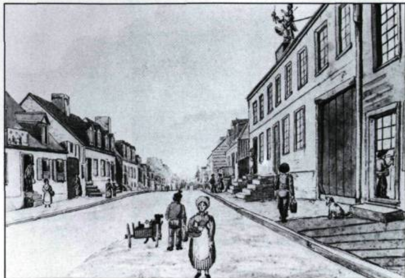
Cette aquarelle de James Pattison Cockburn montre, du côté gauche, la boutique du marchand d'eau minérale du faubourg Saint-Jean, Québec. (Royal Ontario Museum).

se distingue des quatre autres cours d'eau connus, comme le ruisseau Saint-François ou Prévost, les fontaines du Sault-au-Matelot, de Champlain, et particulièrement celle dite d'Abraham Martin ou Claire-Fontaine. Cette dernière, enfouie sous une maison construite peu après la Conquête, fait depuis l'objet de recherches.