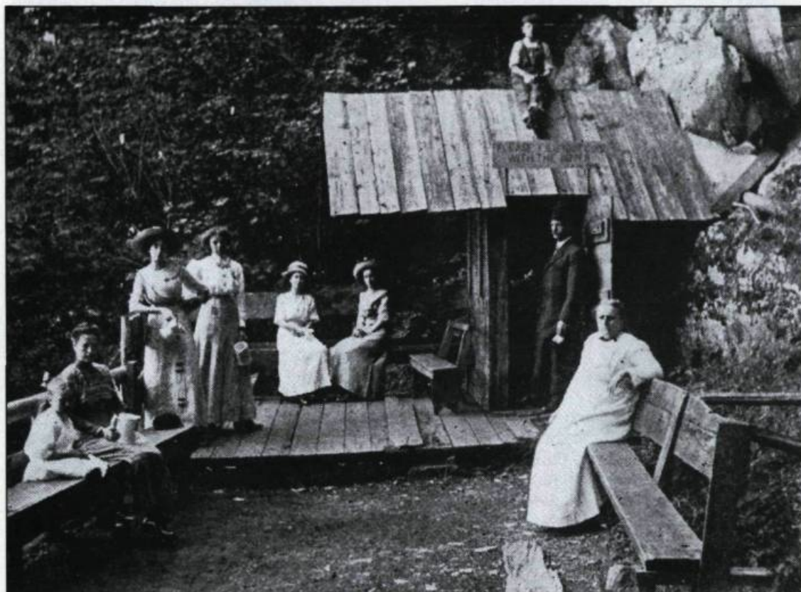
Une des sources d'eau minérale des Cantons de l'Est, celle de Potton White Sulphur Springs dans le comté de Brome. (Carte postale, collection Simon Beauregard).

Construit vers la fin de la décennie 1880, l'hôtel Abénaquis Springs tombe sous le pic des démo-