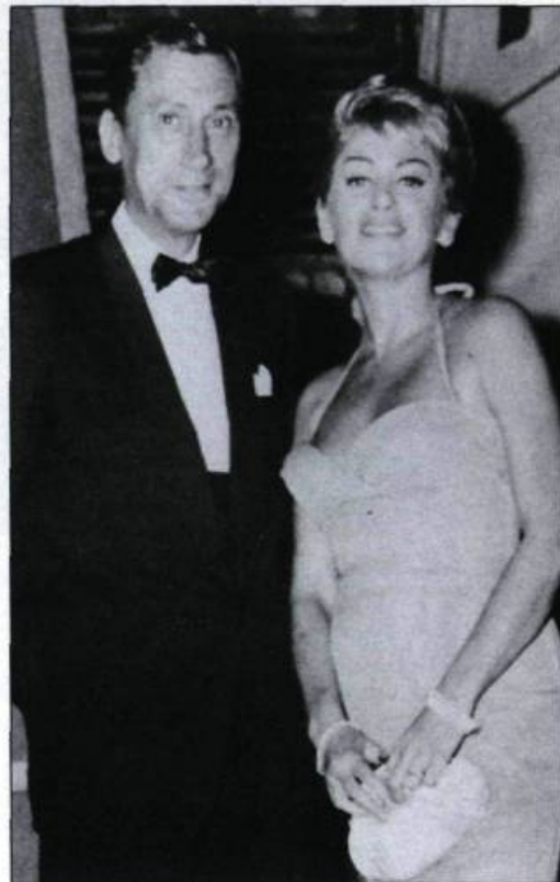
Martine Carol en compagnie de Roger Baulu. (Roger Baulu. CKAC, une histoire d'amour, 1982).