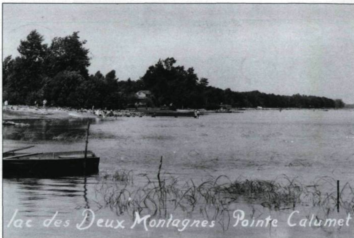
En 1939, le géographe Raoul Blanchard remarque de vastes mouvements de la population montréalaise au cours des mois d'été. Les rivières Mille Îles et des Prairies, les lacs Saint-Louis et des Deux Montagnes constituent des destinations privilégiées. (Carte postale Studio Beauchamps, collection Simon Beauregard).