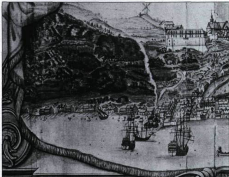
Médaille de la carte de Jean-Baptiste Franquelin en 1688. (partie). Divers types d'embarcations et le Cul-de-Sac où habitait Jacques Bernier.

Quelque temps après son mariage, Jacques Bernier achète une chaloupe d'environ treize à quatorze tonneaux équipée d'un canot pour la somme de 1 400 livres. Il s'engage à faire trois voyages pour le compte du vendeur, à «savoir deux voyages de bois de cordes, et un voyage de