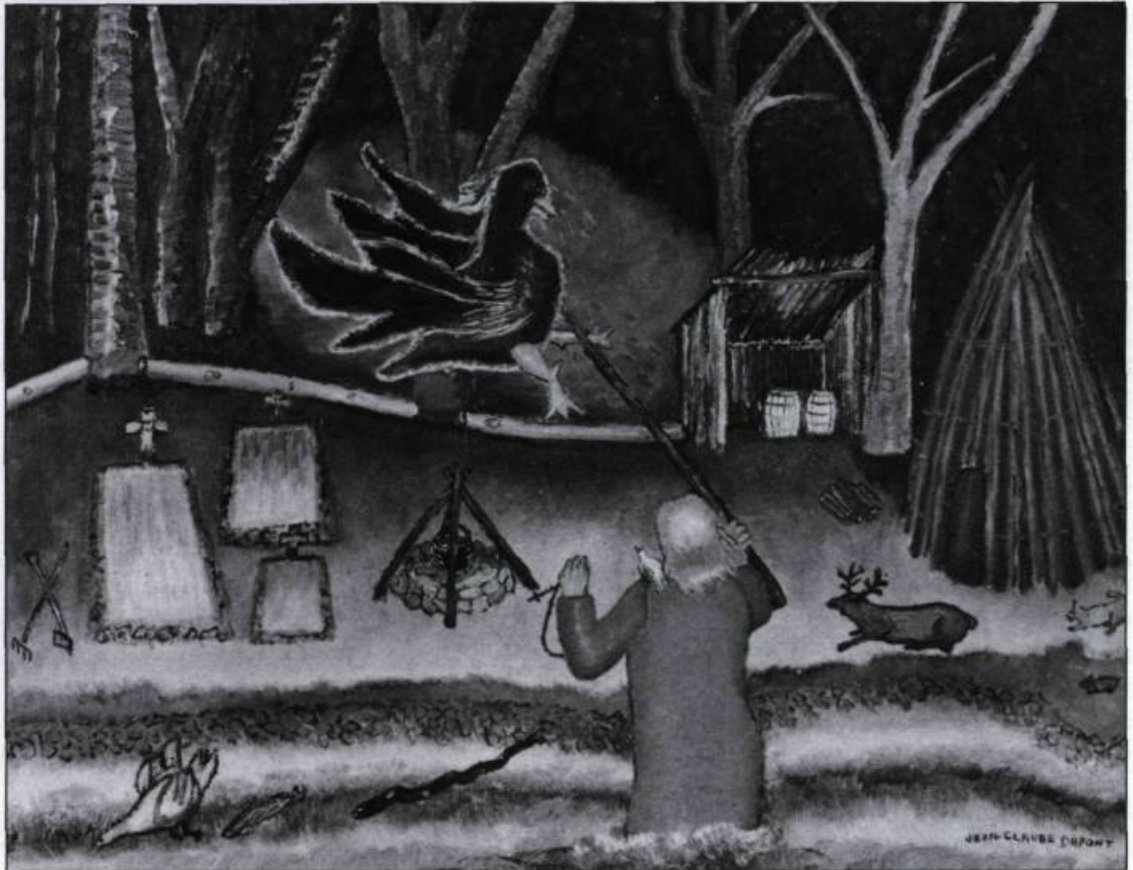
Le grand oiseau noir. La nièce de Roberval, abandonnée avec les siens sur une île, tue l'oiseau qui les décime. Huile sur toile de Jean- Claude Dupont, 1982. (Collection C. Lacroix, Montréal).

Et ce ne sont là que quelques exemples, car le corpus légendaire du Saint-Laurent est très riche. La légende prend sa source dans le mystérieux lointain des origines de la pensée humaine