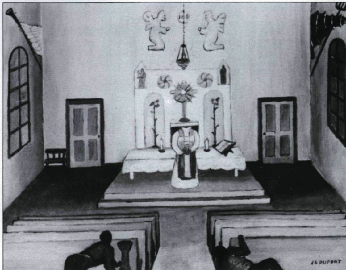
Le prêtre fantôme. Dans le village de l'île Dupas, en face de Berthier, un prêtre sans tête revient dans l'église chanter une messe pour expier un péché. Huile sur toile de Jean-Claude Dupont, 1983. (Collection B. Lacroix, Montréal).

l'île Dupas. Il veut y chanter une messe pour expier un vieux péché. Sur la rive nord de la petite île aux Oies, on trouve encore les traces de murailles d'une forteresse où l'on avait jadis emprisonné un noble français, le «masque de fer». Des chasseurs racontent y avoir entendu des