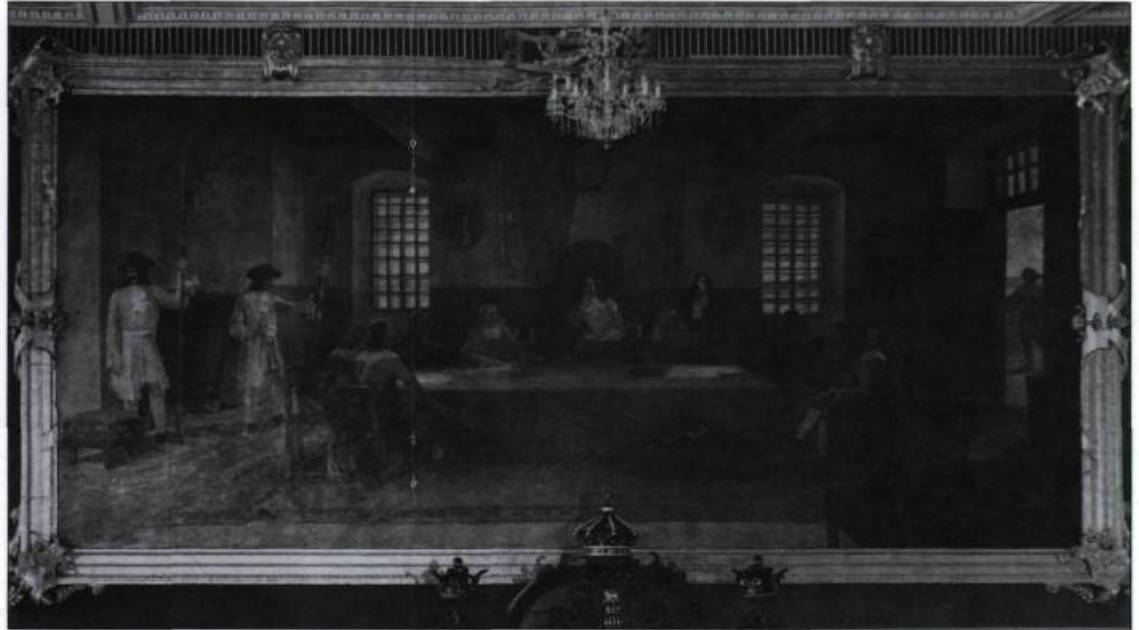
Le Conseil souverain incarne l'autorité suprême en Nouvelle-France. Cette toile marouflée sur le mur orne la salle de l'ancien Conseil législatif au parlement de Québec. (Archives nationales du Québec à Québec).

des familles, demeure une situation temporaire jusqu'à leur remariage éventuel. De plus, trois fois sur quatre, les veuves rencontrées en 1686 à la Prévôté de Québec sont accompagnées par un tuteur, un subrogé-tuteur ou un parent. Ces transactions sont souvent liées à un héritage immobilier. Cette situation s'applique aux femmes seulement puisque les hommes, devenus veufs et généralement tuteurs des enfants mineurs, se présentent seuls devant la cour de justice à titre de gestionnaires des biens de la succession. Ainsi, privilégiés par le veuvage, les droits juridiques des femmes sont reconnus, mais limités dans leur expression légale par la présence des hommes.