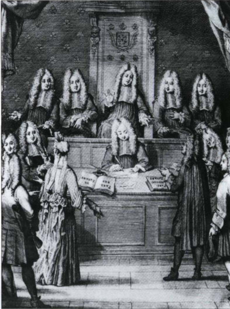
À l'instar du Conseil du commerce qui contrôle le négoce en France, la Nouvelle-France compte une instance juridique principale, la Prévôté de Québec.