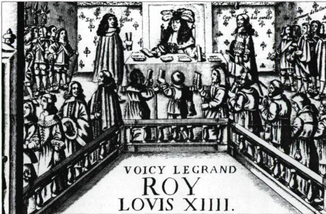
Sous l'Ancien Régime, le roi rend la justice à la Cour de France. Sur cette illustration, deux femmes se disputent un enfant.