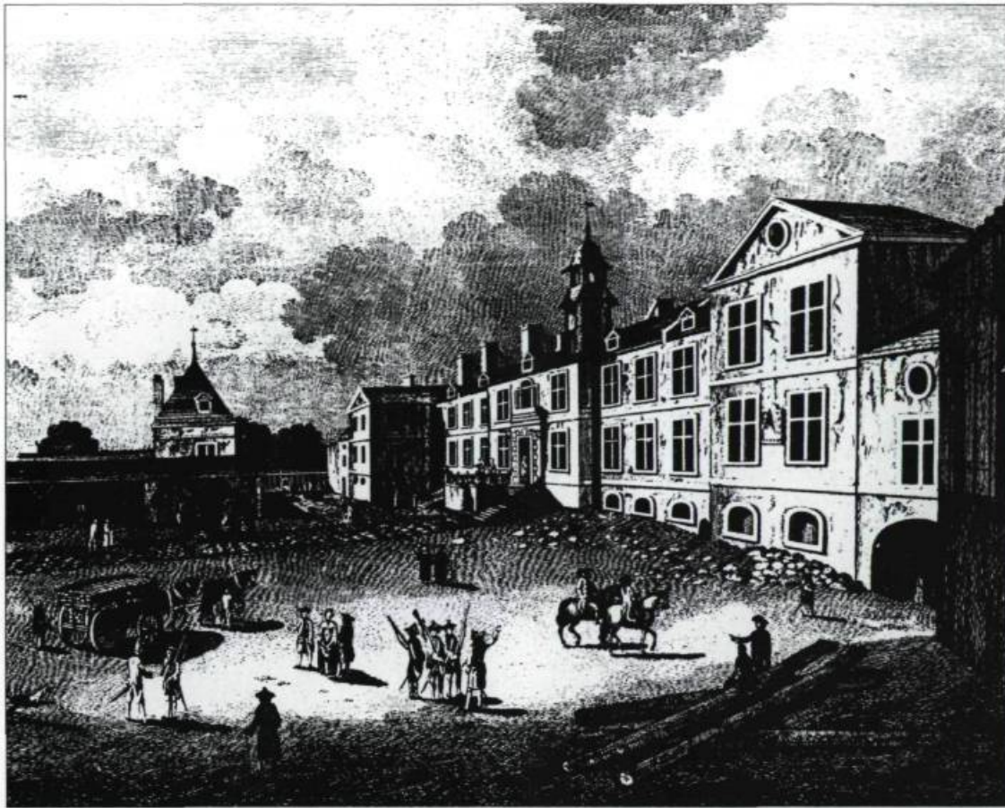
Ce détail d'une gravure de l'officier britannique Richard Short, vers 1760, montre l'emplacement du palais de l'Intendant qui abrite également la Prévôté de Québec. (De Volpi Québec, planche 15).