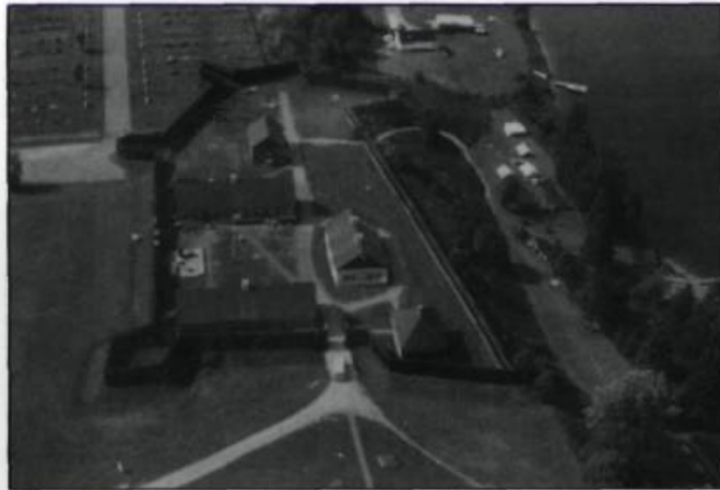
Vue d'ensemble des bâtiments du fort Ingall. Reconstitué à la fin des années 1960, il appartient aujourd'hui à la Société d'Histoire et d'Archéologie du Témiscouata.

Aux premiers temps de la colonie, un plan d'eau de la région du Témiscouata, maintenant appelé le Lac Long, a été dénommé Cabaneau en raison de la forme des montagnes qui l'entourent et qui lui donne l'allure d'une cabane de castor. Le toponyme a ensuite été transféré à la rivière à l'embouchure de laquelle la ville de Cabano s'est développée. Pourtant, cet endroit n'a pas toujours porté ce nom. D'abord connu comme le Poste du Lac, ce lieu devient le fort Ingall au milieu du XIX e siècle.