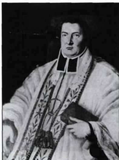
Au début de 1791, la Gazette de Québec ouvre ses pages à un débat sur l'abolition de la tenure seigneuriale opposant l'abbé Thomas Bédard et Charles-Louis Tardieu de La Nauvière. (Archives nationales du Québec, collection Initiale). (Archives nationales du Canada).

L'arrivée de 50 prêtres émigrés chassés par la persécution donne une ultime preuve de la Révolution anti-religieuse. Le clergé et l'ensemble des Canadiens, les dirigeants aussi bien que le peuple, deviennent contre-révolutionnaires. Ils ne pouvaient tolérer un régime qui assassinait le roi et la reine – Louis XVI était toujours le roi dans le cœur des Canadiens –, un régime qui tuait les prêtres, déchristianisait le pays et s'emparait des biens de l'Église et de la noblesse.