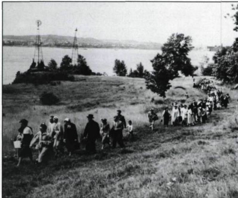
Le 28 juin 1954, lors de la célébration du troisième centenaire de l'établissement de la Congrégation de la Sainte-Vierge chez les Hurons, un groupe d'Amérindiens escalade la plateforme où se trouvait jadis le fort des Hurons à l'Anse du Fort. (Collection d'Adrien Pouliot).

Rageurs, 100 guerriers Onontagués quittent leur bourgade au milieu de l'hiver, «résolus d'enlever de Québec les Hurons, ou de gré ou de force. Ils parurent sur nos frontières au commencement du printemps de 1657, relate la Relation; ils rôdaient de tous côtés pour faire quelque mauvais coup». Le père Le Moyne fait comprendre au capitaine des guerriers que c'est dans un canot de paix que les Hurons accepteront de se rendre