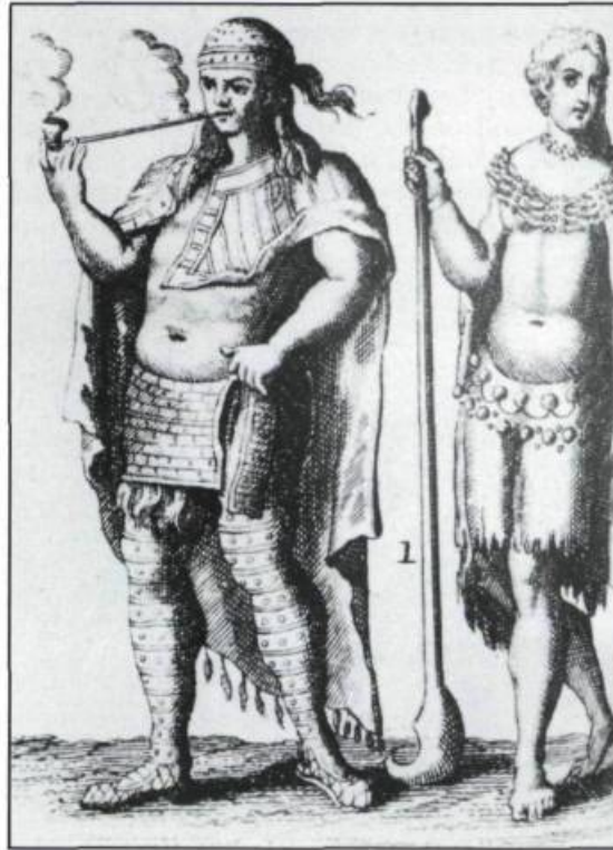
Homme et femme de la tribu des Hurons tels que représentés dans l'ouvrage de Joseph-François Lafitau, s.j., Moeurs des Sauvages Américains, publié à Paris en 1724.

Pratiquement exterminés par l'offensive iroquoise de 1648 et 1649, les Hurons chrétiens, réfugiés d'abord sur l'île Saint-Joseph (aujourd'hui l'île-aux-Chrétiens) persuadent leurs missionnaires, au printemps de 1650, de les emmener à Québec et de les mettre sous la protection du gouverneur français. Le vendredi 10 juin, 70 canots d'écorce, chargés de tous les bagages, tant des Français que des Hurons, et d'au moins 360 passagers se dirigent vers Québec. Ils y abordent le 28 juillet. Hospitalières, Ursulines, Jésuites et quelques familles québécoises en hébergent près de la moitié. Environ 200 autres se débrouillent jusqu'en mars 1651, où toute la colonie huronne s'établit sur les terres d'Éléonore de Grandmaison. Le 25, le père Pierre-Joseph-Marie Chaumonot, missionnaire des Hurons depuis 1639, les rejoint en compagnie du «donné» Eustache Lambert et d'un autre domestique, Pierre Hébert dit La Pierre. Le 18 avril suivant le Journal des Jésuites rapporte que: « la distribution fut faite des terres désertées [défrichées] de Mademoiselle de Grandmaison en portions de 20, 30 ou 40 perches. Mais tout le monde fut content, et on commença dès lors à semer ». Dès 1650, le père Paul Ragueneau, qui avait organisé la descente à Québec d'un premier groupe de 300 Hurons, savait que 300 autres Amérindiens, conduits par