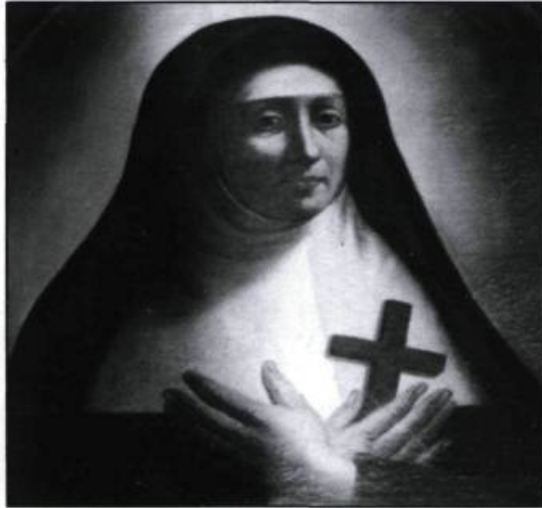
La Mère Saint-Joseph, l'une des fondatrices des Ursulines. Ses talents de musicienne fascinaient les petites Amérindiennes et Canadiennes. (Monastère des Ursulines).

l'Anse aux Canots, portant ainsi à 800 ou 900 les Hurons réfugiés au bout de l'île. Mais les Iroquois les gardent à vue, si ce n'est à la portée de leur tomahawk. Au cours d'un escarmouche, 70 Hurons furent tués ou fait prisonniers. Craignant de nouveaux raids iroquois, les Hurons quittent précipitamment leurs terres avant même les récoltes. Campés de nouveau près du fort de Québec, ils sont relocalisés, en juillet 1656, à Notre-Dame de Lorette. Marie de l'Incarnation s'efforce de les secourir en leur offrant des broderies et des dorures, pour la décoration de leur nouvelle chapelle.