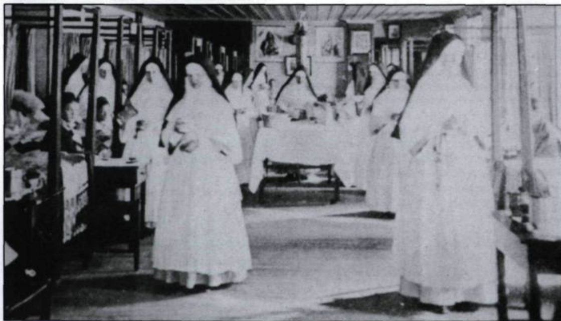
Chambre de malade à L'Hôtel-Dieu de Québec à la fin du XIX e siècle. (Archives du Monastère de L'Hôtel-Dieu de Québec).

Les guerres iroquoises déciment les populations amérindiennes qui fréquentent l'hôpital. Par contre l'arrivée du régiment de Carignan et de