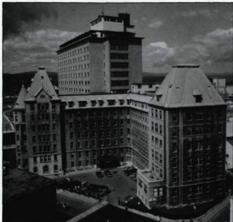
L'hôpital Hôtel-Dieu de Québec aujourd'hui. (Archives du Monastère de L'Hôtel-Dieu de Québec).

En 1931, la restauration complète du bâtiment et l'ajout du pavillon Richelieu et de l'aile du Précieux-Sang permettent de porter le nombre de lits à 375. Par la suite, l'ensemble architectural subit une seule transformation majeure, soit l'addition d'une tour de 14 étages qui remplace, à la fin des années 1950, l'ancien pavillon d'Aiguillon.