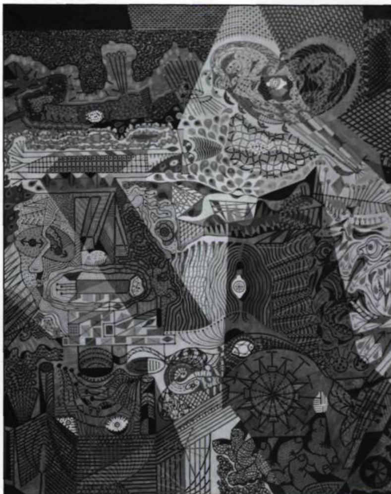
dont il illustre les recueils de poèmes, Les Îles de la nuit et Le Voyage d'Arlequin , en 1944 et en 1946 respectivement.

De plus en plus, par la suite, Pellan évitera les affrontements et préférera consacrer toutes ses énergies à la création. Il produit abondamment en suivant les mouvements de son instinct et de ses profondes convictions artistiques. La tendance surréaliste qui s'était dessinée dans son oeuvre au contact des trouvailles et idées des Breton, Picasso, Miro, Klee, Tanguy sur la scène parisienne, se développe à l'occasion de ses amitiés pour Alain Grandbois et Éloi de Grandmont