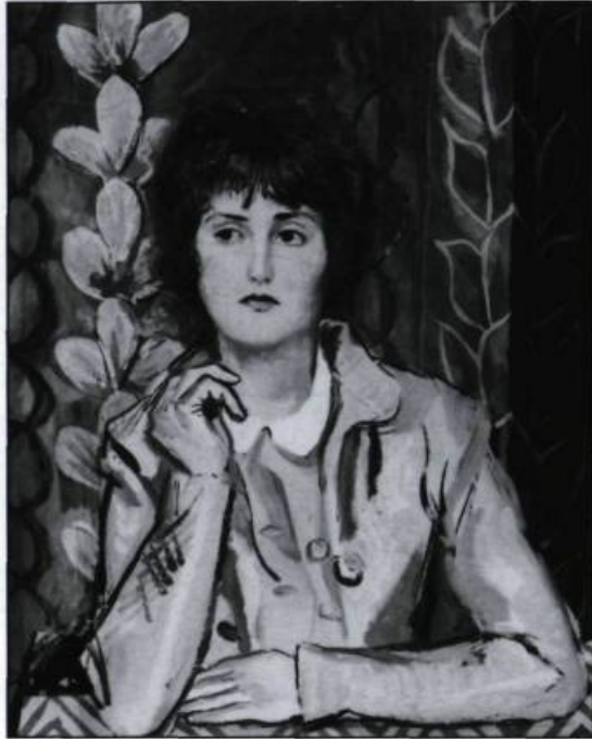
«Jeune fille au col blanc». Huile sur toile vers 1933.

Merveilleusement doué, Pellan assimile rapidement les leçons de ses maîtres et accumule les succès pendant ses années d'apprentissage; au terme de ses études, il rafle les premiers prix dans toutes les matières. Et pour tout couronner, il se voit attribuer en 1926 l'une des premières bourses du gouvernement québécois pour aller compléter sa formation à Paris.