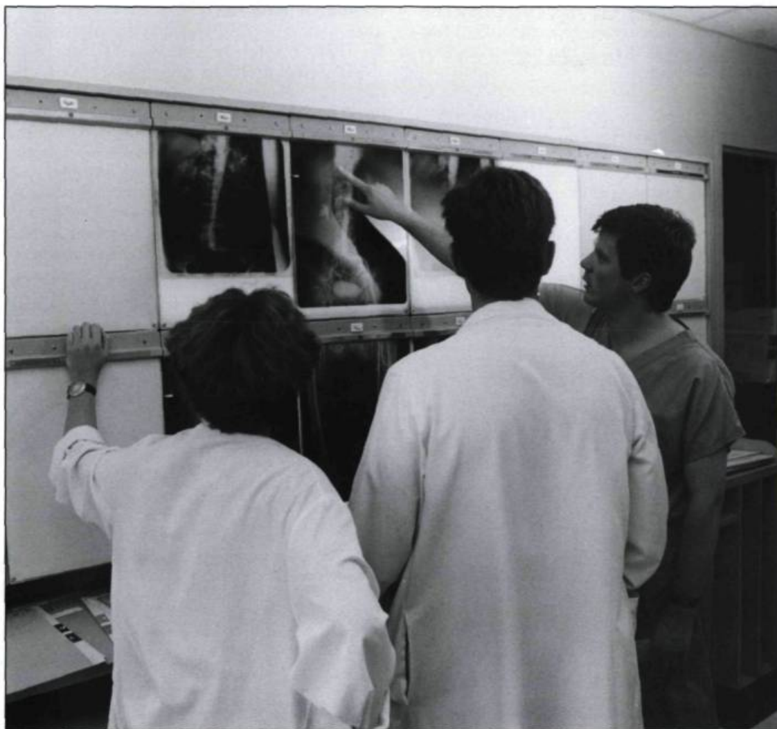
L'enseignement de la médecine représente l'une des grandes missions de l'Hôtel-Dieu de Québec. (Photographie médicale, Hôtel-Dieu de Québec).