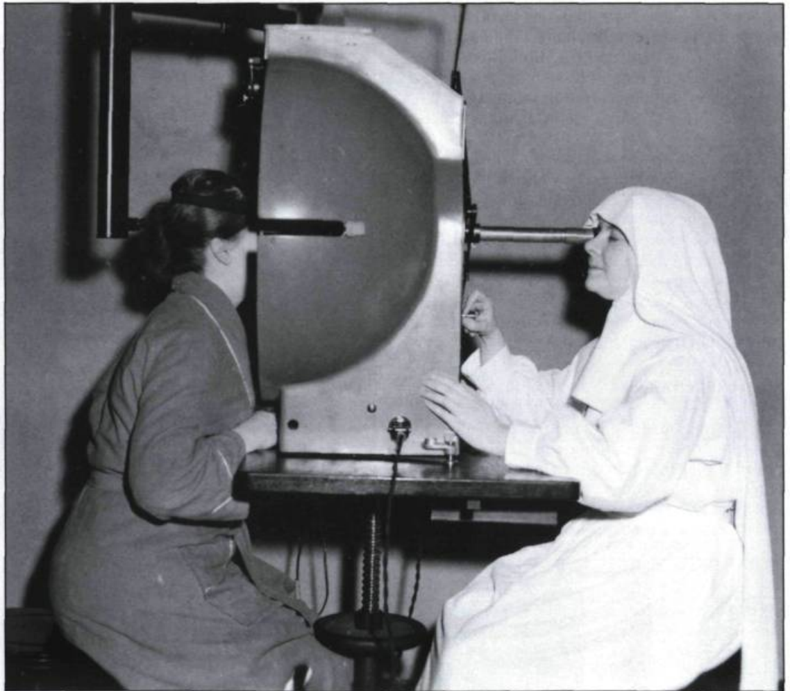
Les hospitalières n'hésitent pas à se perfectionner face au développement rapide des différentes spécialités. (Photographie médicale, Hôtel-Dieu de Québec).

En 1943, l'université acquiesce à la demande des religieuses de l'Hôtel-Dieu désirant se spécialiser davantage et établit une École supérieure en Sciences hospitalières. La première année du cours conduit au certificat et la seconde au baccalauréat.