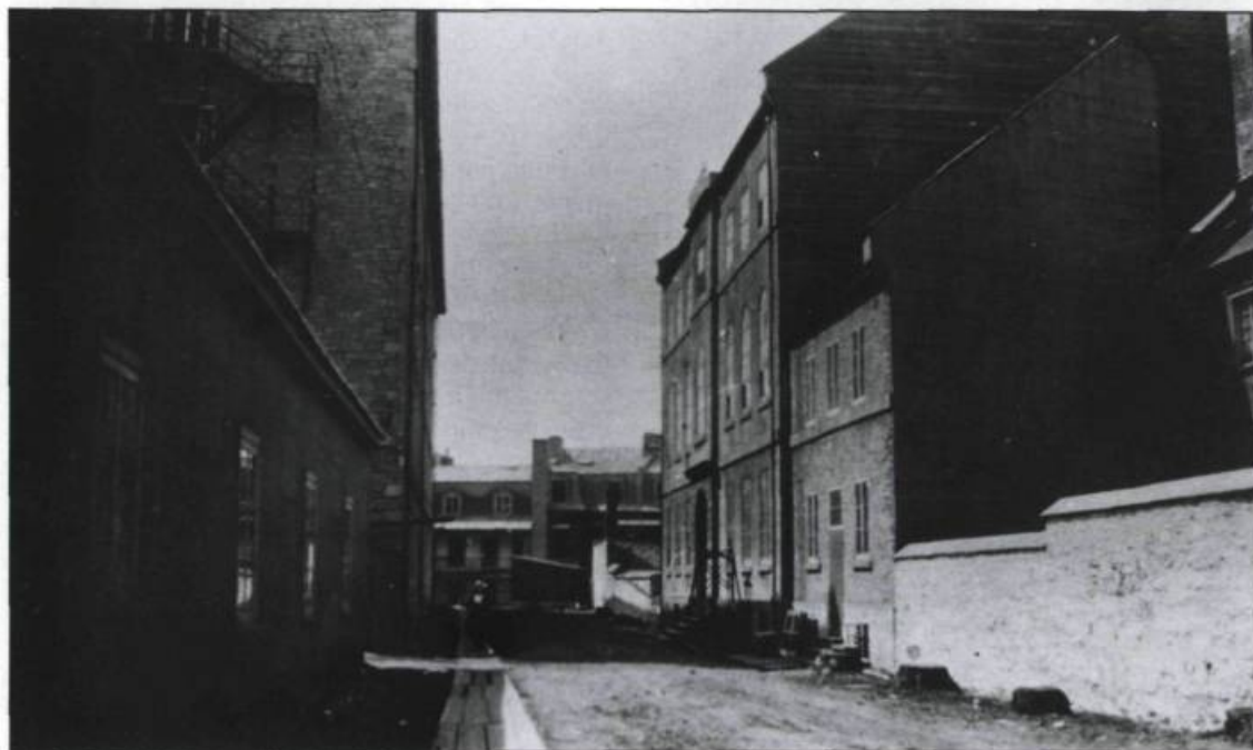
La faculté de médecine de l'université Laval collabore étroitement avec l'Hôtel-Dieu de Québec. Photographie prise vers 1900. (Ville de Québec, Division du Vieux-Québec).

En 1831, la Chambre d'Assemblée du Bas-Canada met sur pied le premier bureau médical de la province chargé d'examiner les aptitudes des candidats médecins. L'aspirant doit d'abord compléter une cléricature de cinq ans avec un