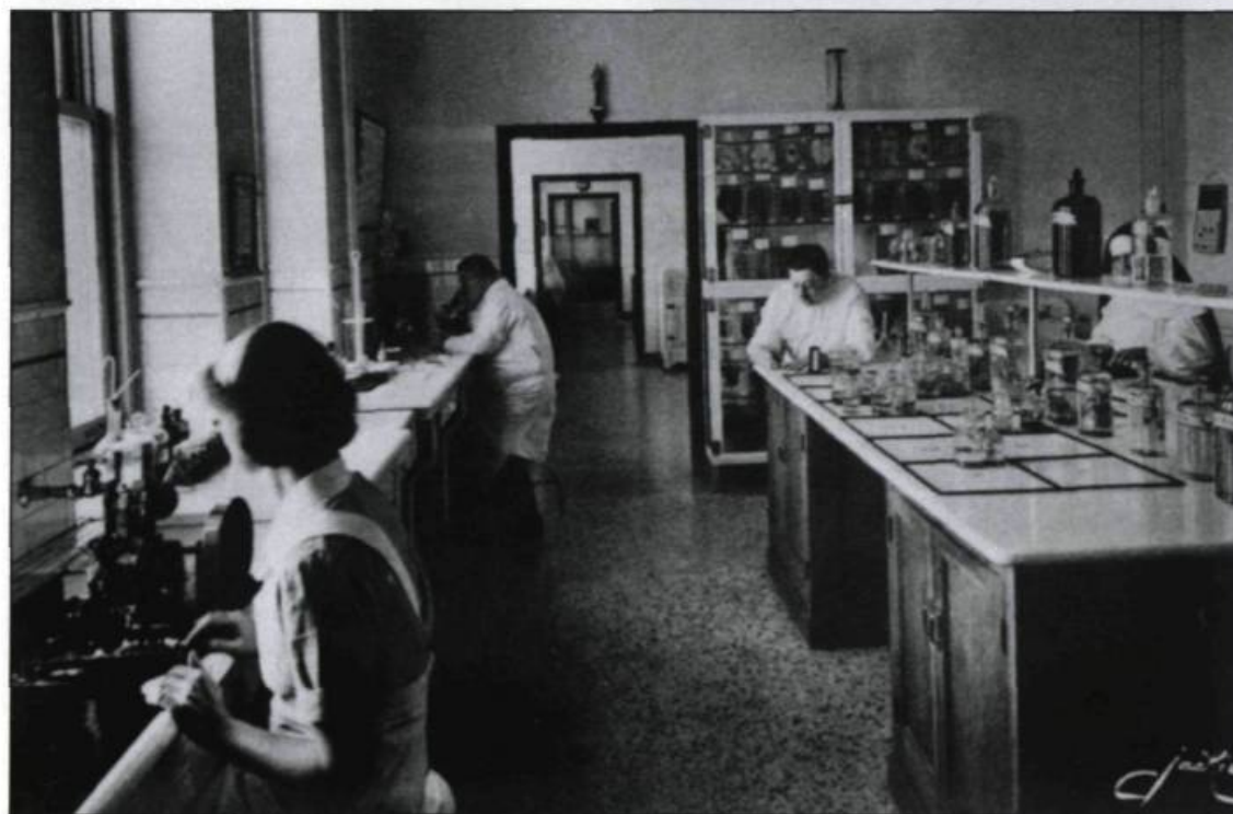
La formation pédagogique destinée aux futures religieuses-infirmières leur permet de travailler dans différents secteurs, comme la recherche en laboratoire.