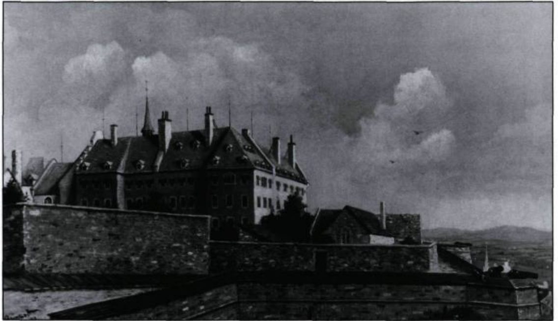
L'Hôtel-Dieu vu de la rue des Remparts en 1886, d'après H. Bunnett. (Ville de Québec, Division du Vieux-Québec).

L'espace disponible permet d'accueillir 50 lits; cependant, à cause des compressions budgétaires, l'hôpital compte à peine 20 places. Jus-