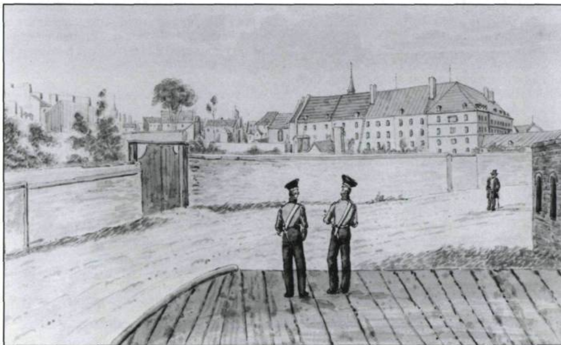
L'Hôtel-Dieu de Québec vers 1832, d'après une aquarelle de James Pattison Cockburn. (Ville de Québec, Division du Vieux-Québec).

Dès l'automne 1755, les travaux de reconstruction débutent. Au milieu de l'année 1757, les hospitalières emménagent dans leur nouveau monastère. L'entrepreneur, Jacques Deguise dit Flamand, respecte le plan initial de François de Lajoüe. Des escaliers, œuvres de Joseph Anger, témoignent encore de cette époque.