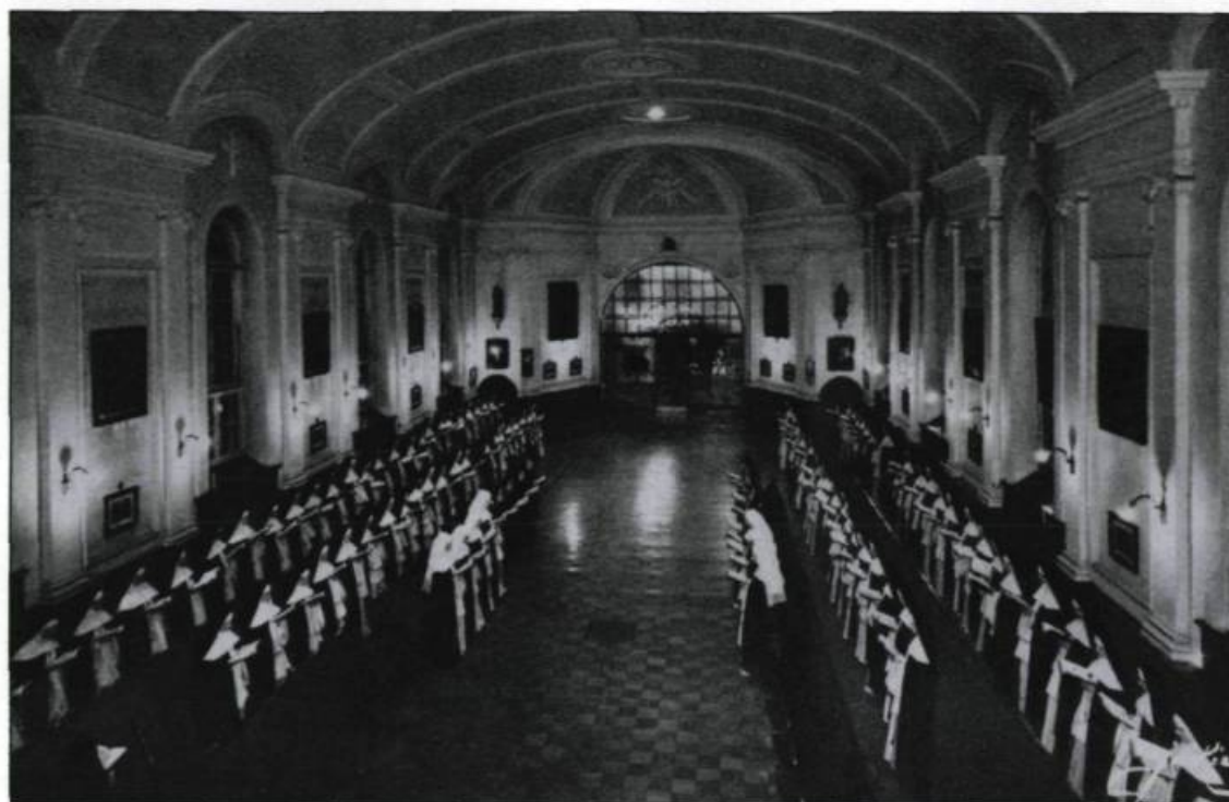
Les hospitalières de l'ordre de Saint-Augustin, réunies pour l'office des Matines, dans la nuit de Noël.

En effet, un passage tiré des Annales de l'Hôtel-Dieu de Québec de 1648 révèle que les religieuses se font «un plaisir de les loger, de les nourrir et de les instruire des usages de Canada, pendant qu'ils préparent leur demeure.» Elles offrent encore l'hospitalité de leur hôpital aux pères jésuites en juin 1640, lors de l'incendie de leur maison. Pour des raisons identiques, elles ouvrent toutes grandes les portes de leur monastère pour accueillir les ursulines en décembre 1650 et en octobre 1686.