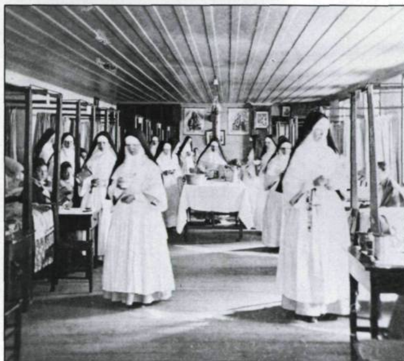
Les religieuses s'affairent à la distribution des repas en 1877.

La communauté des Augustines connaît un recrutement important à la charnière des XIX e et XX e siècles. Auparavant, le noyau des religieuses se veut beaucoup plus limité. Entre 1639 et 1671, trente religieuses font partie de la communauté de l'Hôtel-Dieu de Québec et vingt-deux d'entre elles proviennent de France. En 1650, sœur Marie-Françoise Giffard de Saint-Ignace, fille du seigneur Robert Giffard, médecin de l'Hôtel-Dieu, devient la première hospitalière canadienne. Sept ans plus tard, la communauté accueille en son sein la première huronne à se faire religieuse au Canada, sœur Sainte-Geneviève-Agnès Skannud-Haroï de Tous-les-Saints.