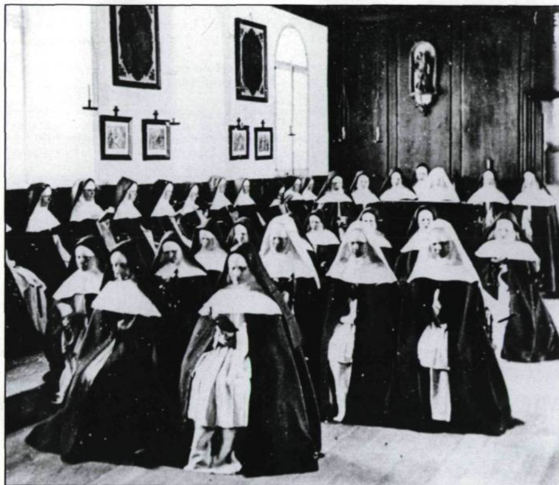
Prière dans la chapelle intérieure. (Ville de Québec, Division du Vieux-Québec).