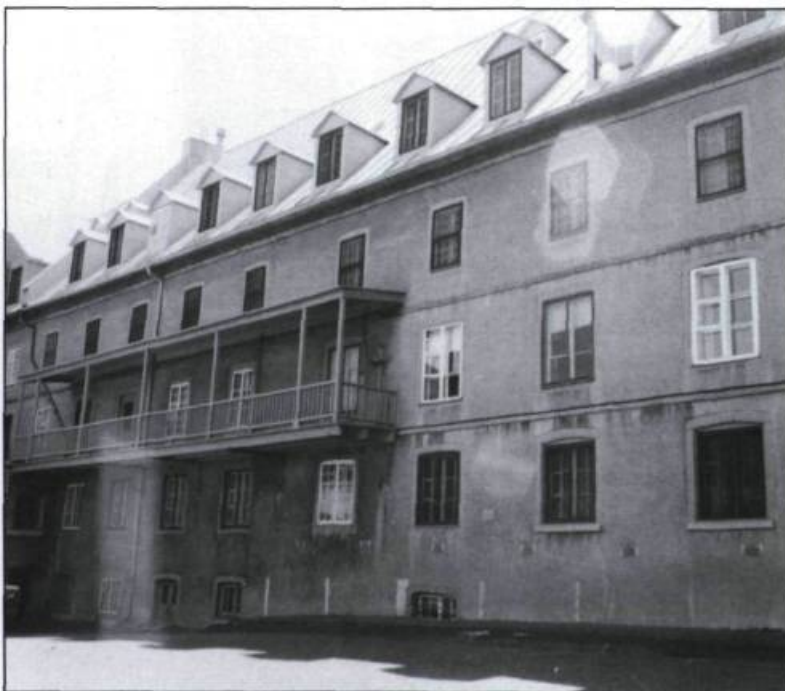
Le noviciat construit en 1756. (Ville de Québec, Division du Vieux-Québec).

Aussi, dès 1922, des pourparlers s'entament entre les Augustines du Canada afin de trouver des solutions. La difficulté de l'isolement des monastères se résout avec la création de la Fédération des Monastères des Chanoinesses Hospitalières de la Miséricorde de l'ordre de Saint Augustin au Canada, le 5 mars 1957. Le monastère de l'Hôtel-Dieu de Québec, berceau de la branche canadienne de l'ordre, abrite le siège de la nouvelle fédération et le demeure jusqu'en 1962, date où le Conseil général se transporte sur le chemin Saint-Louis, à Sillery.