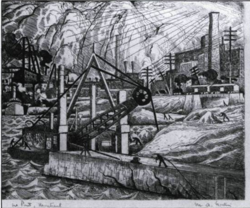
«Le Port, Montréal». Eau-forte et pointe sèche par Marc-Aurèle Fortin.