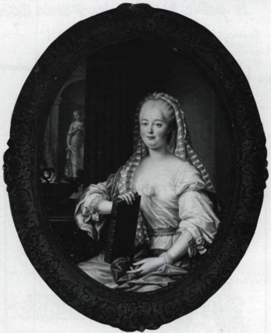
Jeanne-Antoinette Poisson, marquise de Pompadour (1721-1762). Huile de François-Hubert Drouais. (Collection Musée David M-Stewart, le Vieux-Fort, Ile Ste-Hélène, Montréal).

À l'occasion de la Quinzaine internationale de théâtre de Québec, le public aura le plaisir d'admirer les estampes originales et les costumes de la «Nuit des Rois». Présentée en 1945 par les Compagnons de Saint-