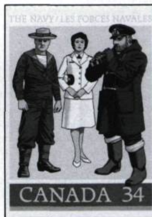
Quatre timbres émis en 1983, 1984, 1985 montrant des uniformes militaires des armées de terre, de l'air et de mer à différentes époques.

Le prestige de l'uniforme! Quel pays, même le plus pacifique ne s'en est-il pas servi pour enflammer l'imagination des jeunes recrues? Sur les timbres du 10 novembre 1983 quatre tenues militaires des Régiments de 1883 sont illustrées. Ces soldats semblent hésiter entre l'époque des uniformes romantiques et les tenues de combat plus près des conceptions modernes de la guerre.