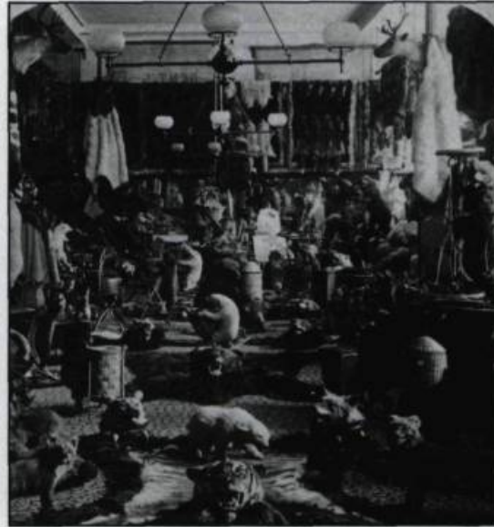
Le salon de fourrures du magasin J.-B. Laliberté en 1894 et 1899..

La production de vêtements occupe une place assez considérable dans l'ensemble de l'activité manufacturière de Québec au cours des dernières décennies du XIX e siècle. Selon le recensement du Canada de 1891, la production des modistes, couturières, tailleurs, fourreurs, chapeliers et des fabricants de corsets, gants et mitaines, bonnets, chemises, cravates et sous-vêtements se chiffre à 2 585 213 $, ce qui représente 17 pour cent de la valeur totale des produits manufacturiers de Québec.