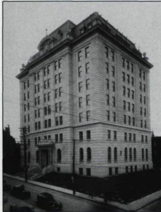
L'édifice «D», que la Société immobilière du Québec vient de restaurer, a été construit en 1931-1932 pour loger un ministère en pleine expansion: l'Agriculture. La construction visait notamment à contrer le chômage.

Tout aussi francophile, l'idéologie libérale qu'incarne Taschereau prône le renouvellement de la société par l'industrialisation et l'éducation. Cette