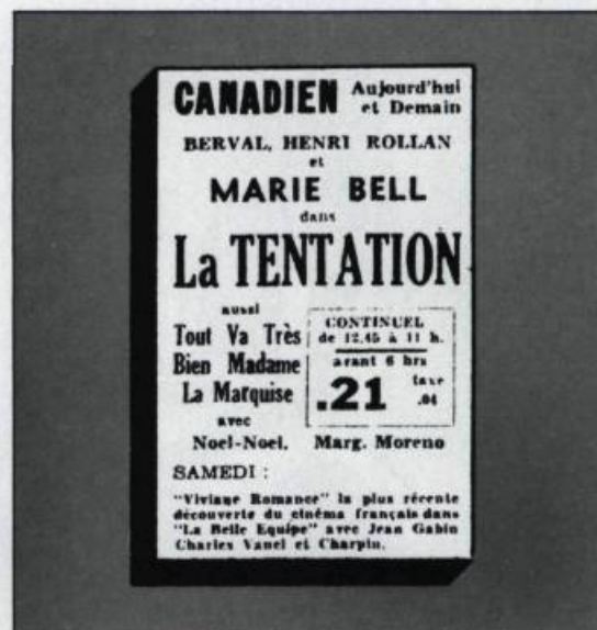
Le cinéma Canadien, sur la rue Saint-Jean, annonce le film « La Tentation ». (Le Soleil, 7 janvier 1937).

sont filmées par France-Film et ce film, auquel s'ajoutent des scènes de la vie du saint homme, est présenté en primeur le lendemain à Québec, aux cinémas Victoria et Canadien. Ce film fait cependant contraste avec la programmation française habituelle alors dominée par les succès de Gaby Morlay, d'Edwidge Feuillière, de Rosine Deréan, de Claude Dauphin et d'autres. Marie Bell triomphe dans le film La tentation , drame de Charles Méré. Peu auparavant, une équipe française est venue tourner au Québec Maria Chapdelaine avec Madeleine Renaud dans le rôle titre. Les affiches du cinéma américain sont illuminées par les noms d'Irene Dunne, de Clark Gable, de Spencer Tracy, entre autres.