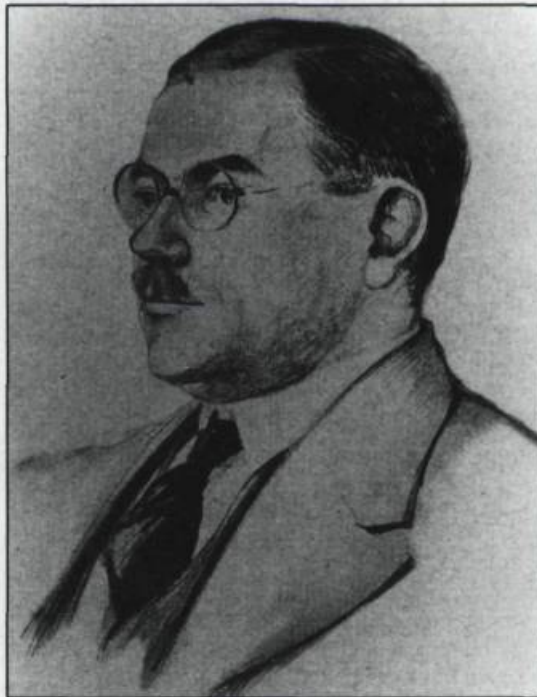
Le journaliste Louis Francoeur, auteur de la pièce « Télévise-moi ça » en 1936.

dredi, en vue de représentations qui avaient lieu le samedi et le lundi soir (avec une matinée pour les enfants, le dimanche, lorsque la chose était permise). Devant des mises en scène aussi rapides, le spectateur ne savait s'il devait apprécier le talent des comédiens autant que le rôle capital des souffleurs. Fred Ratté, considéré comme le meilleur comédien de la ville (le «Fred Barry de Québec»), faisait lui-même les adaptations et les coupures des pièces, car une censure sévère interdisait toute allusion à l'amour libre, aux amants et aux maîtresses. Ratté, qui n'avait pas le physique des jeunes premiers, jouait habituellement le troisième rôle, celui du méchant, du traître, de l'homme aux couteaux, qu'il incarnait à merveille avec son rude visage et ses longs cheveux.