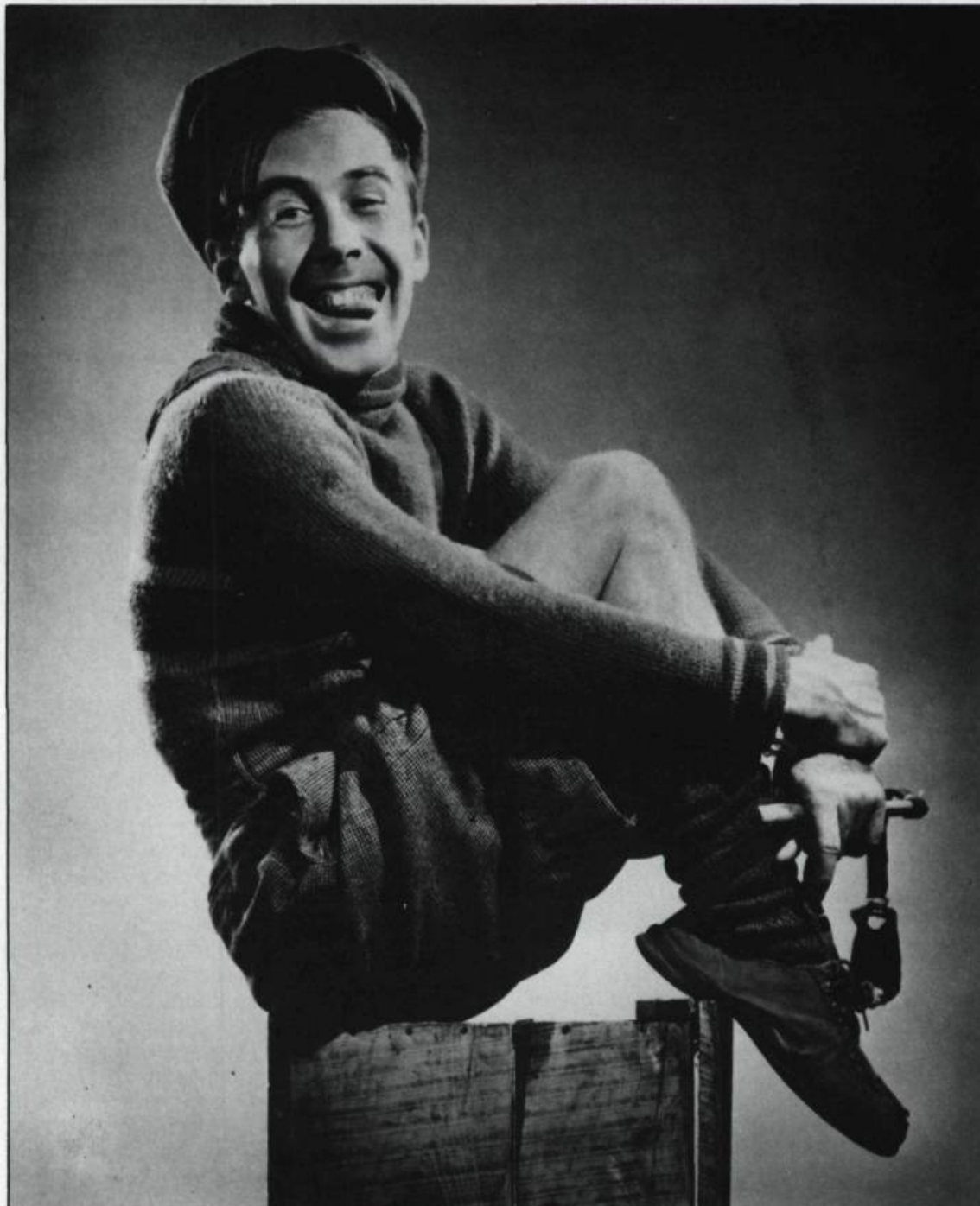
Gratien Gélinas dans le rôle de Fridolin, en 1938. (Collection Gratien Gélinas).

versité Laval, revient d'Ottawa. Il est allé dans la capitale fédérale pour y présider à la formation d'un comité régional d'organisation du second