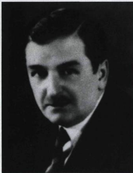
Le Premier ministre du Québec, Maurice Duplessis, vers la fin des années trente.