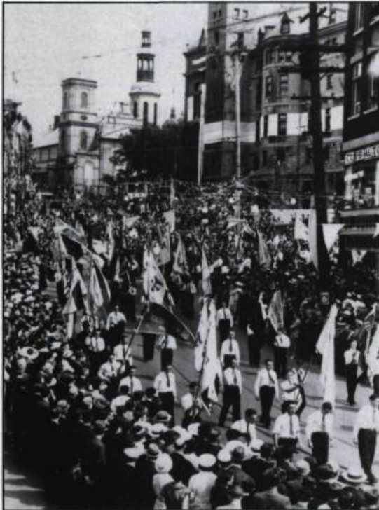
Procession du Congrès eucharistique descendant la Côte-de-la-Fabrique le 26 juin 1938.

Parallèlement à l'Union dramatique et parfois, semble-t-il, en symbiose avec elle, une autre entreprise théâtrale remarquable de l'époque fut le Conservatoire national de musique de Québec qui, sous la direction du Docteur Jean Dussault,