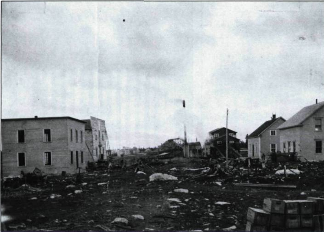
Vue du village Lac Frontière en 1914. On aperçoit, à l'horizon, le moulin de B.C. Howard.

visage de la ville. Après avoir connu différentes raisons sociales, elle disparaît, en 1921, entraînant presque dans sa chute la Banque Nationale, qui lui avait accordé de trop nombreux et substantiels prêts. Enfin, signalons la fondation en 1931 de la M.E. Binz Co., une industrie de soies naturelles et artificielles. En 1948, cette manufacture emploie, selon le quotidien Le Soleil , environ 700 travailleurs.