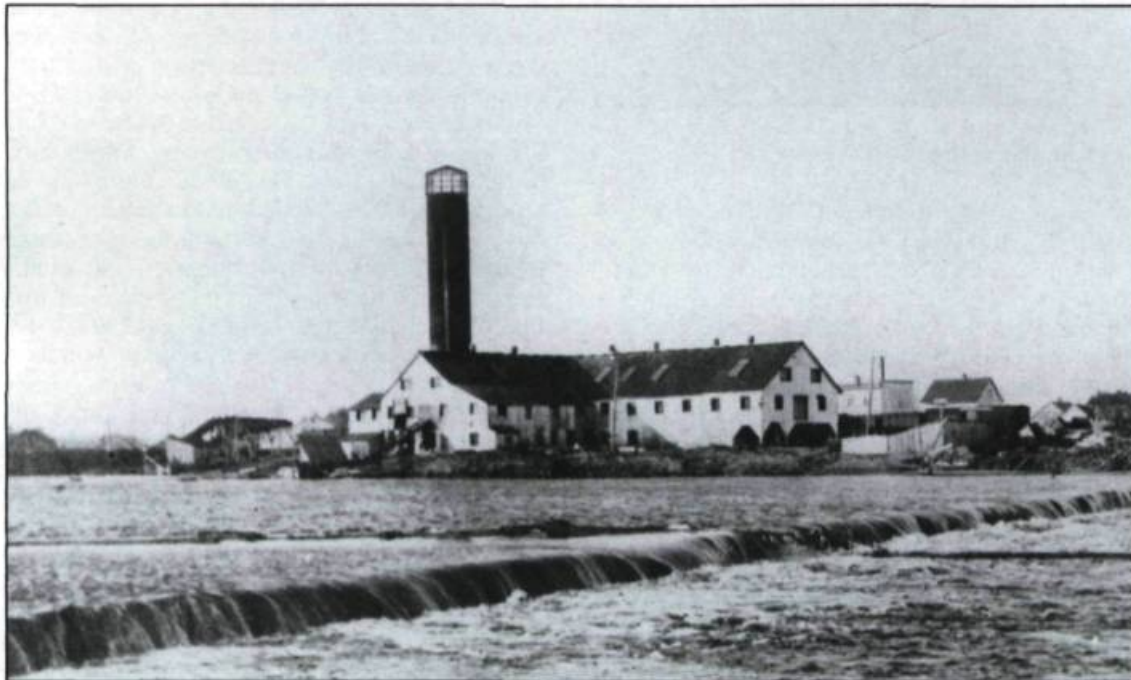
Le moulin à scie de la compagnie Price à Montmagny, au début du XX ème siècle. (Archives nationales du Québec).

transformation des billots en bois scié est assurée depuis les débuts par un réseau de scieries disséminées le long des rivières de la région. Pendant toute cette période, de 1850 à 1940, la plupart de celles-ci appartiennent à de petits entrepreneurs et desservent d'abord la population locale. Mais quelles que soient leurs dimensions, les scieries sont souvent à l'origine d'un village et contribuent à sa survivance: Saint-Pacôme, Saint-Pamphile, Lac de l'Est, Sainte-Euphémie et Daquam-St-Juste doivent directement leur prospé-