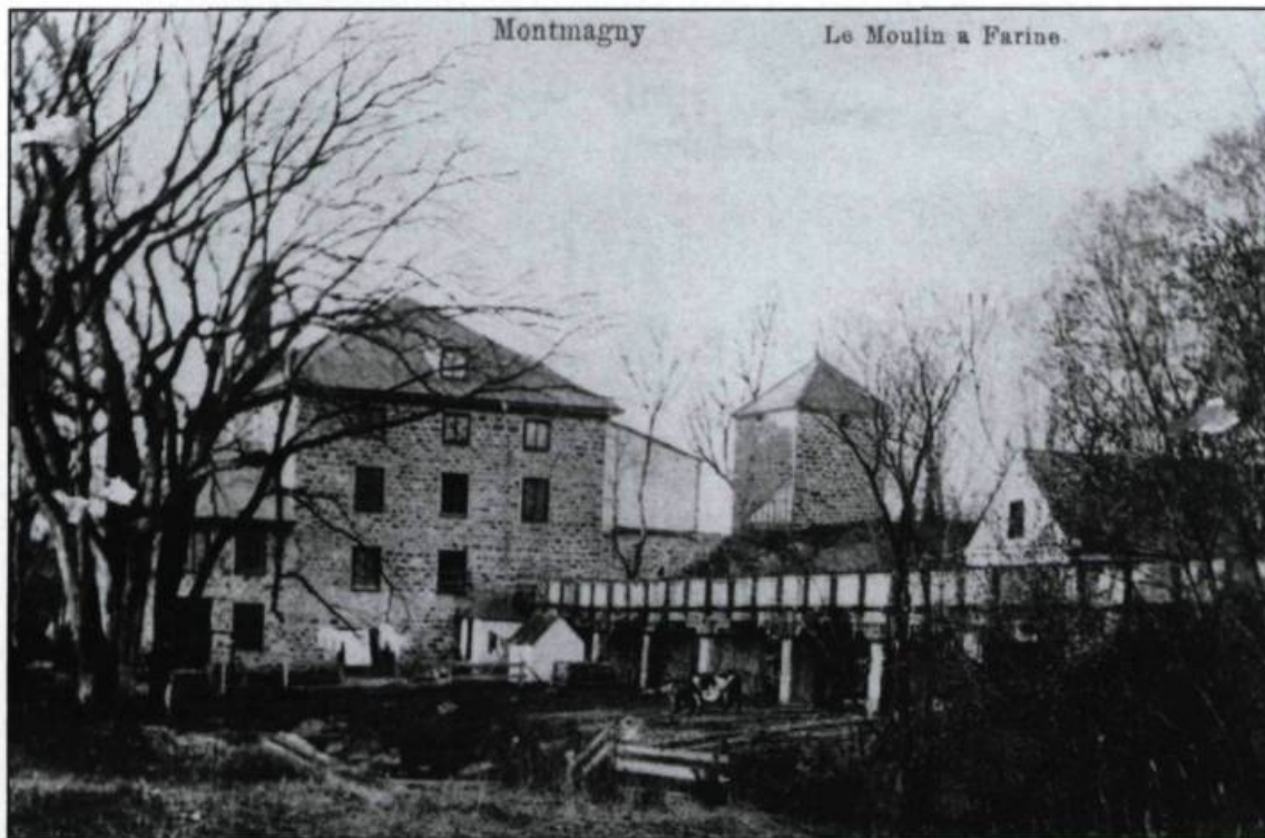
Le vieux moulin à farine de Montmagny, vers 1910. (Collection Yves Hébert).

plusieurs boutiques d'artisans et des auberges. Dans les paroisses environnantes, il y a des scieries, des «moulins à grains» et des fermes florissantes. De plus, selon Bouchette, les cultures de Rivière-Ouelle n'en cèdent guère à celles des autres seigneuries de la province. Les goélettes de Kamouraska et de Rivière-Ouelle sont bien connues à Québec pour la grande quantité et la qualité des provisions qu'elles apportent: grains, volailles, sucre d'érable, beurre.