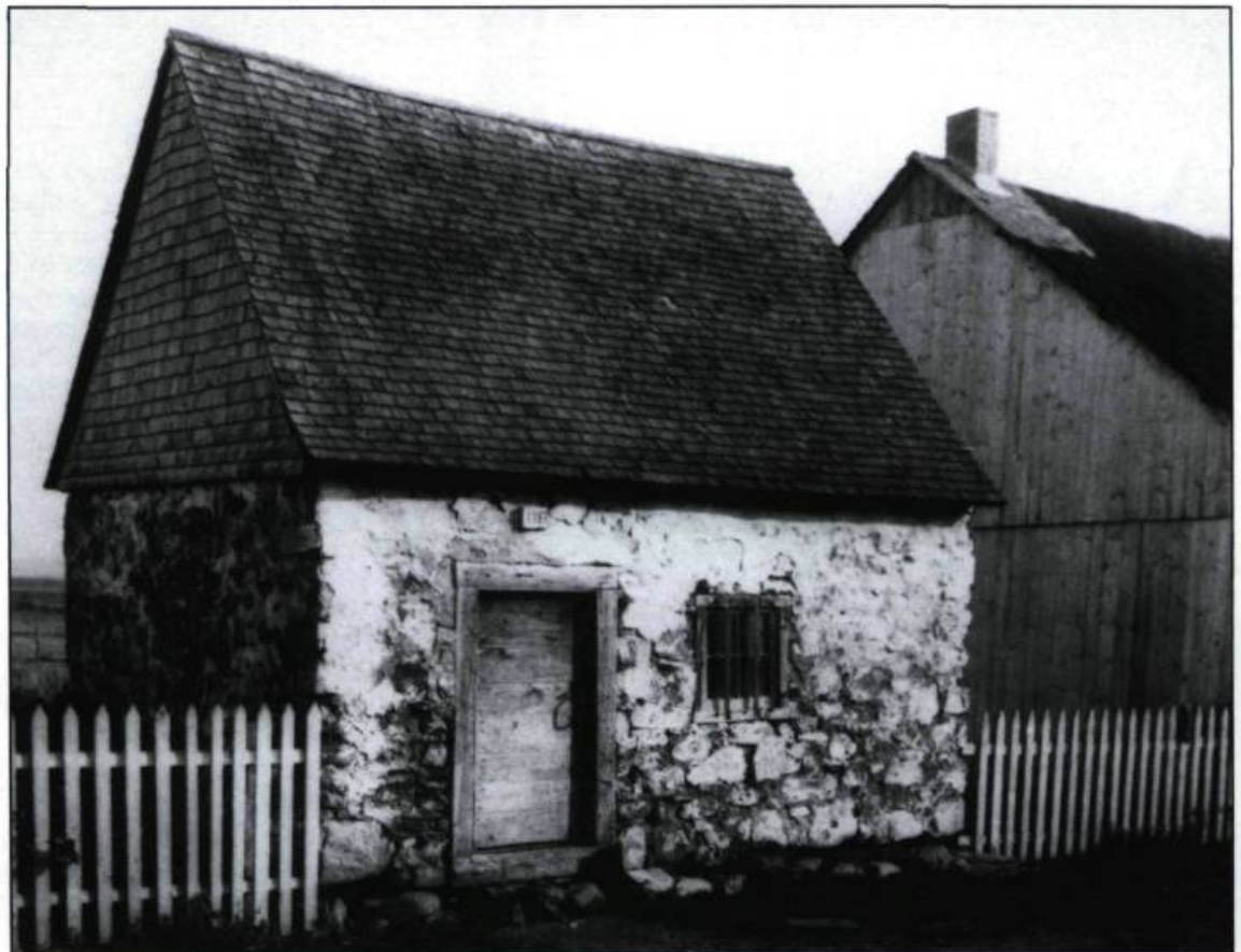
Laiterie construite en 1793 à Kamouraska.

Grâce aux travaux de l'arpenteur Joseph Bouchette au début XIX ème siècle, nous savons que la Côte-du-Sud, et particulièrement la région de Montmagny, constitue alors le «grenier du bas district». La description qu'il fait de Saint-Thomas définit assez bien l'aisance des habitants. On y retrouve de belles maisons entourées de beaux jardins et de bons vergers, des fermes fertiles,