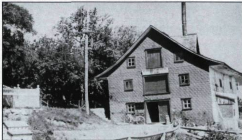
L'école d'industrie laitière de Saint-Denis-de-Kamouraska. (Société historique de la Côte-du-Sud).

La fin du XIX ème siècle est marquée par le développement considérable de l'industrie laitière au