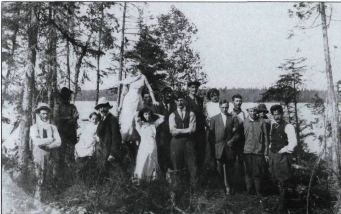
Groupe de colons au lac Okikiska, en Abitibi (6 juillet 1912).

culture devaient entraîner dès 1840 un mouvement migratoire vers les États-Unis. Ce mouvement prend une ampleur plus considérable au fur et à mesure qu'avance le XIX ème siècle. En effet, selon le géographe Raoul Blanchard, plus de 1 000 personnes quittent à chaque année la région pour les États-Unis ou pour les territoires de colonisation du Québec. Ce phénomène a même incité un généalogiste de Bellechasse à dénombrer les mariages de Franco-Américains de son comté. Au début du XX ème siècle, Kamouraska est le territoire le plus affecté. En 1909, 298 personnes quittent le comté; les deux tiers se dirigent vers les États-Unis. L'émigration touchera à peu près toutes les paroisses de la région.