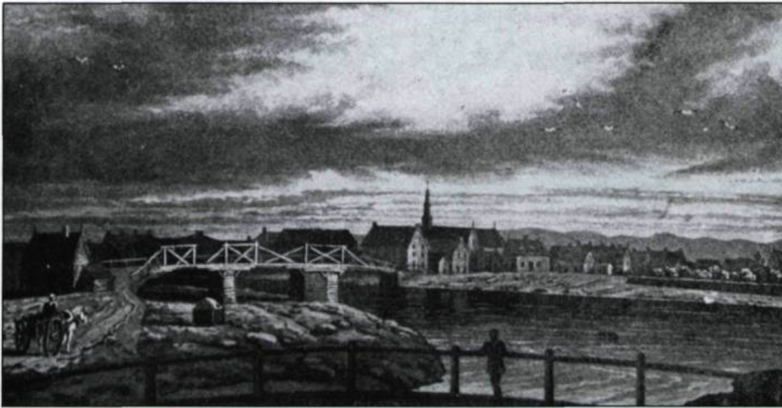
Le village de Montmagny au début du XIX ème siècle.

villageois; d'autre part, les seigneuries de la Côte-du-Sud se trouvent relativement saturées. Selon l'arpenteur Joseph Bouchette, qui parcourt la région au début du XIX ème siècle, il reste bien peu de nouvelles terres à concéder dans la zone seigneuriale.