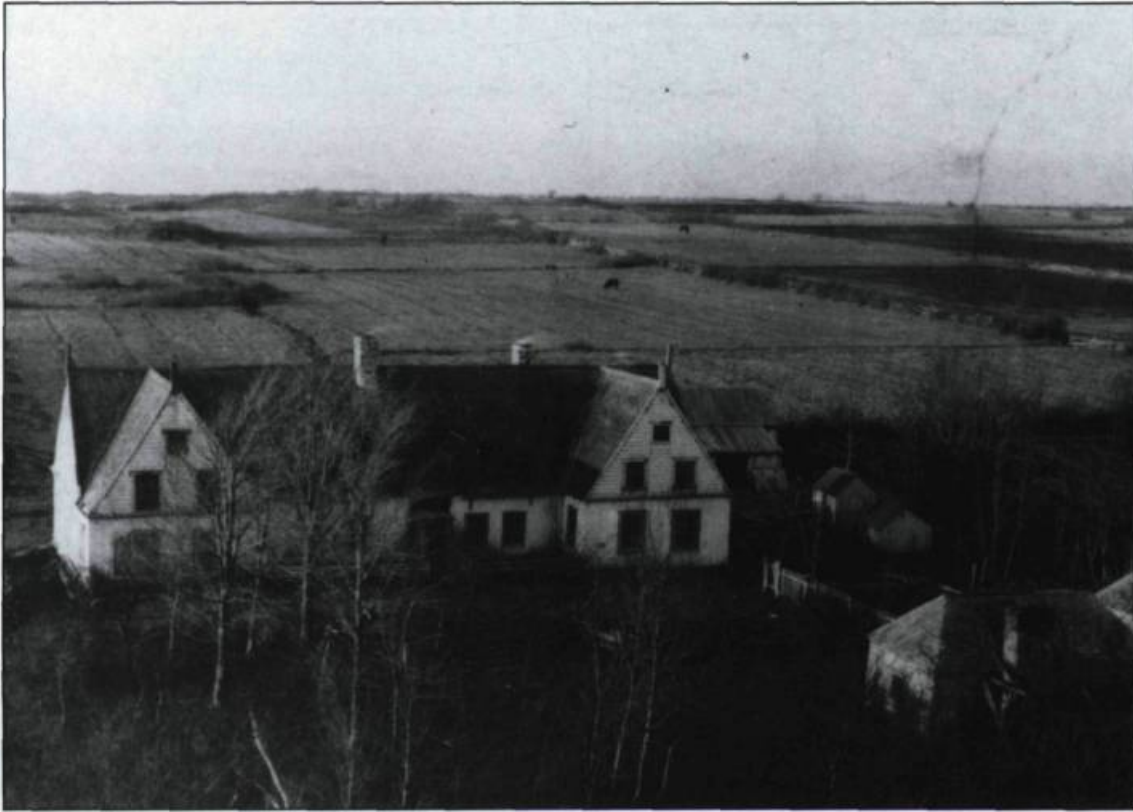
Manoir de la famille Aubert de Gaspé, à Saint-Jean-Port-Joli, vers la fin du XIX ème siècle.