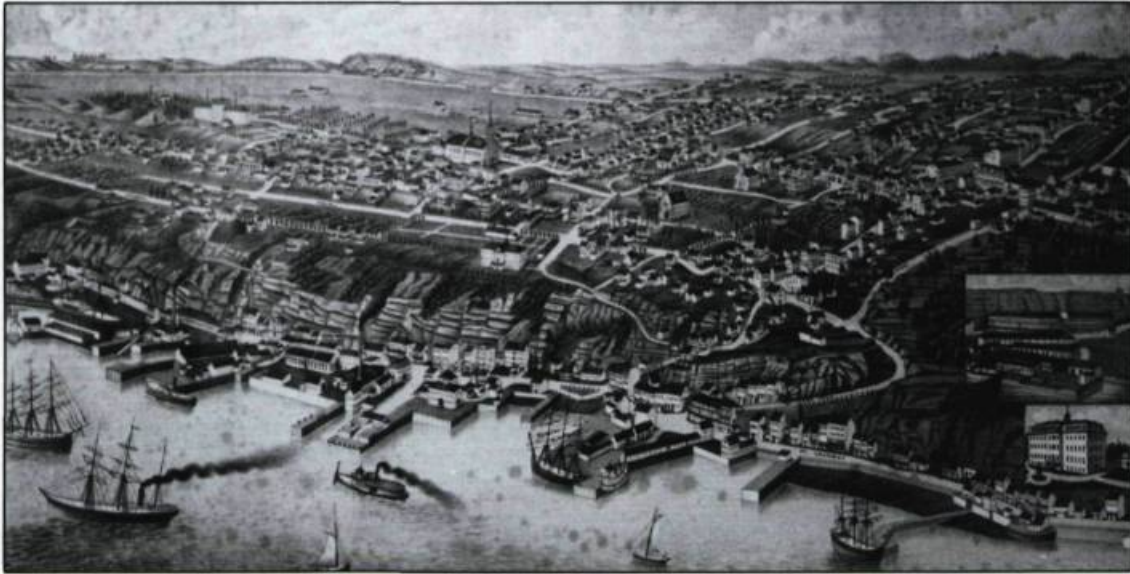
Vue aérienne de Lévis en 1881.