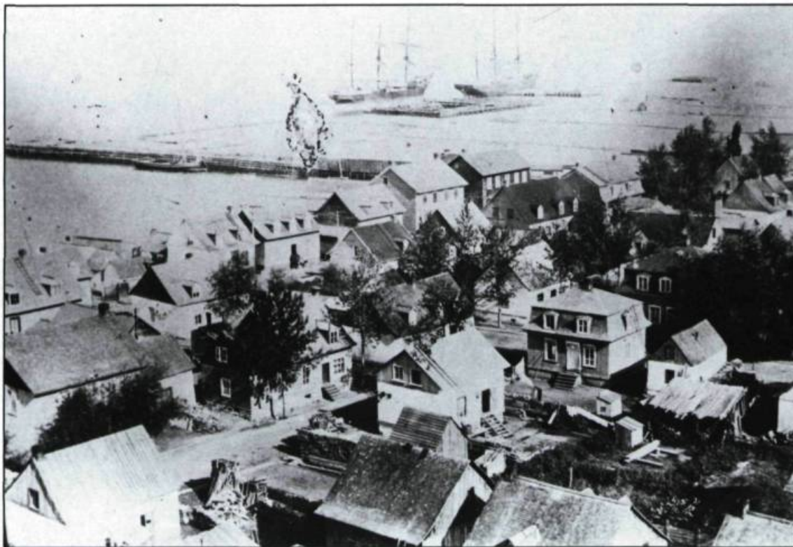
New Liverpool (aujourd'hui inclus dans Saint-Romuald), un bourg ouvrier construit à proximité de Lévis.

celle du bois de sciage perd de la vitesse. À la fin du XIX ème siècle, les chantiers de bois ne trouvent plus leur profit et, les uns après les autres, ferment définitivement leurs portes. Les chantiers navals, de leur côté, éprouvent de sérieuses difficultés. Ils ne peuvent, pour la plupart, faire face à la modernisation des transports maritimes et, en particulier, à l'avènement des vapeurs et des navires construits en acier. De tous les chantiers, un seul, le chantier Davie, sait relever le défi que pose à l'industrie l'apparition des «vaisseaux de métal». L'arrivée sur la rive-sud du chemin de fer va compenser le déclin des chantiers et assurer à Lévis un essor sans précédent.