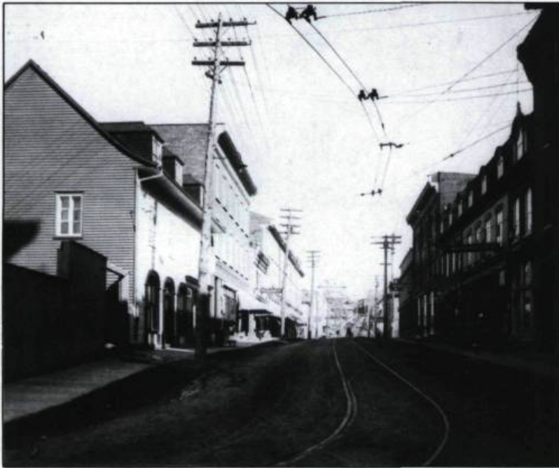
La Côte du passage au début du XXIème siècle. (Archives nationales du Québec).

Pour la plupart entreprises familiales et artisanales, ces scieries, fonderies, fabriques de limes, chaussures, instruments aratoires, articles de toutes sortes deviennent florissantes. La compagnie Carrier & Lainé, entre autres, s'impose comme le plus important atelier de construction mécanique du Canada. À la fin du XIXième siècle, cette industrie, située près de la traverse, emploie jusqu'à 600 personnes.