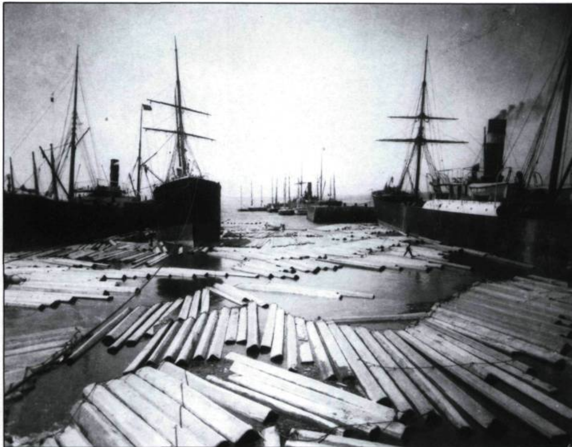
Vue de l'Anse-aux-Sauvages, à Lauzon, en 1895.

le potentiel de ses rivières et ses nombreuses anses constitue un territoire des plus attrayants. Conjuguons à cela la profondeur du chenal du fleuve Saint-Laurent qui permet aux bateaux anglais de fort tonnage de venir jusqu'à ses rives et l'apport de nouveaux éléments fort dynamiques que sont les «lumber Lords» et nous retrouvons ainsi tous les facteurs qui enclenchent le processus d'appropriation et d'exploitation du littoral sud.