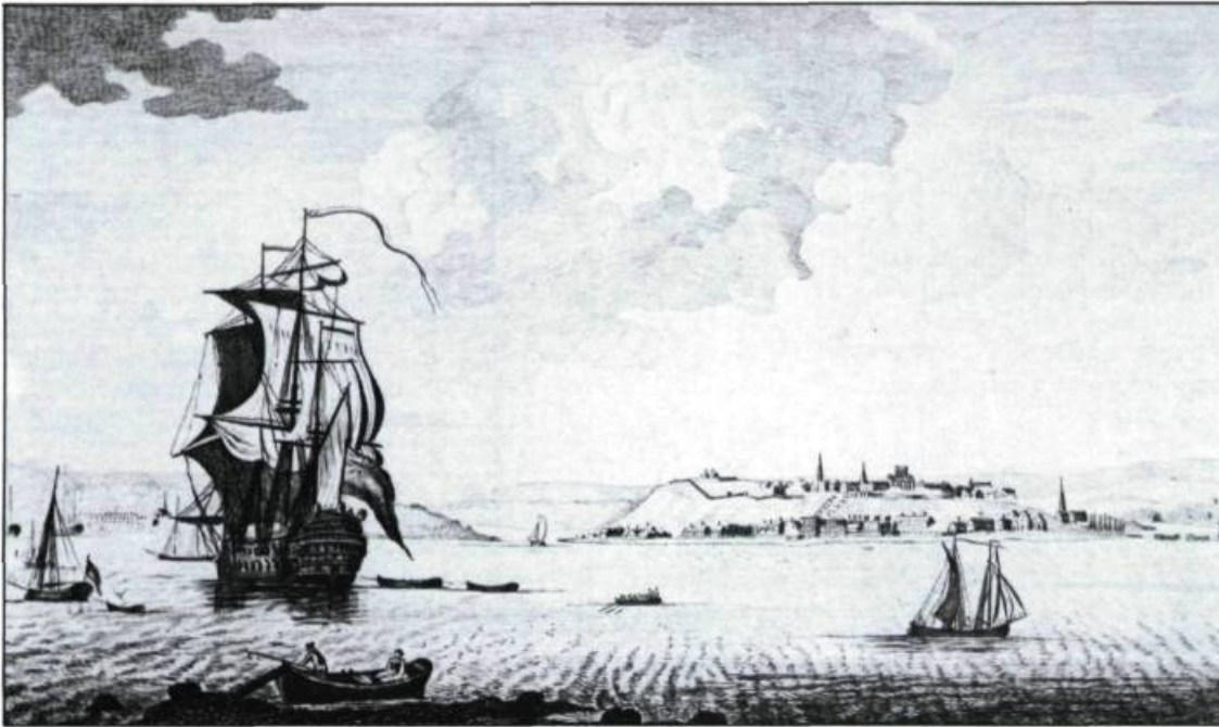
Navire britannique devant Québec, vers 1765. (Royal Ontario Museum).