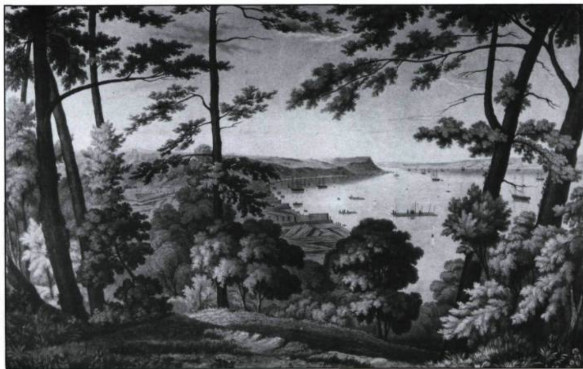
Bois accumulé dans l'Anse Wolfe près de Québec. Aquarelle de James P. Cockburn vers 1830. (Archives publiques du Canada).