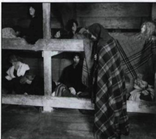
Reconstitution historique de l'intérieur d'un navire d'immigrants, vers 1830. (Musée canadien des civilisations).

participation de la plupart d'entre eux à l'économie coloniale et leur asservissement au système impérial les rend plus sensibles aux activités commerciales qu'aux besoins de la population. Périmée en Angleterre, l'administration des juges de paix s'avère impuissante face à l'urbanisation rapide. Elle est d'autant plus incompétente que ses magistrats se trouvent associés à l'élite commerciale, ce qui a pour conséquence un développement inégal des services publics à tous les niveaux.