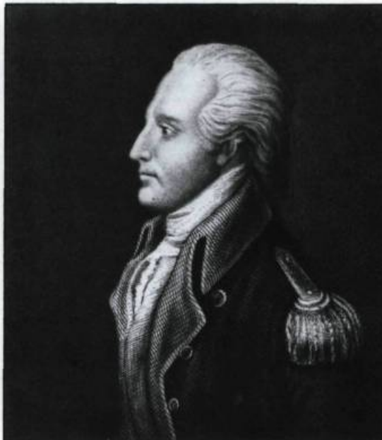
Portrait de Benedict Arnold (1741-1801), officier dans l'armée américaine.

Le chemin de fer fait enfin son entrée à Saint-Georges en 1907, ce qui facilite le transport du bois et favorisera l'industrialisation subséquente. Le projet de rendre le chemin de fer de la Beauce jusqu'aux États-Unis, en suivant la route Lévis-Jackman, est abandonné avec la faillite du Kennebec Railway. La nouvelle compagnie, le Québec Central, préfère relier Lévis aux États-Unis par les