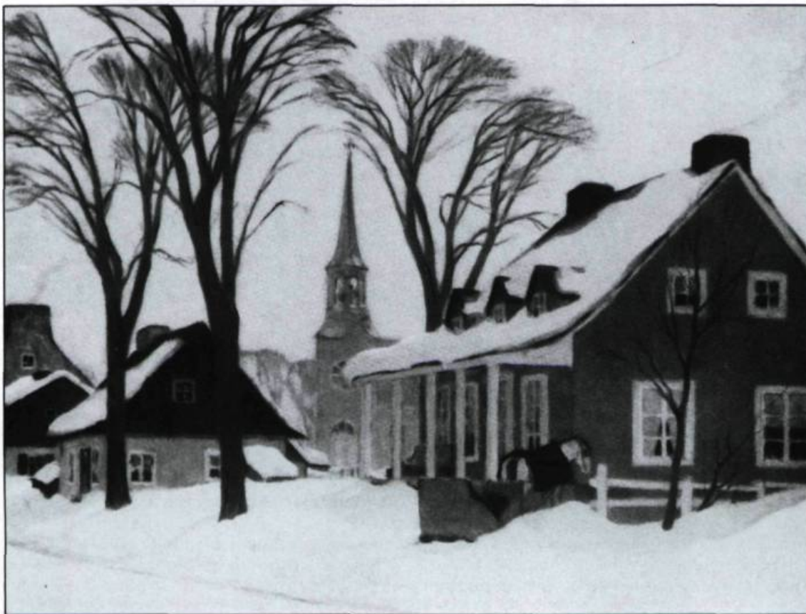
L'hiver à Baie-Saint-Paul. Huile sur toile de Clarence Gagnon (1881-1942).