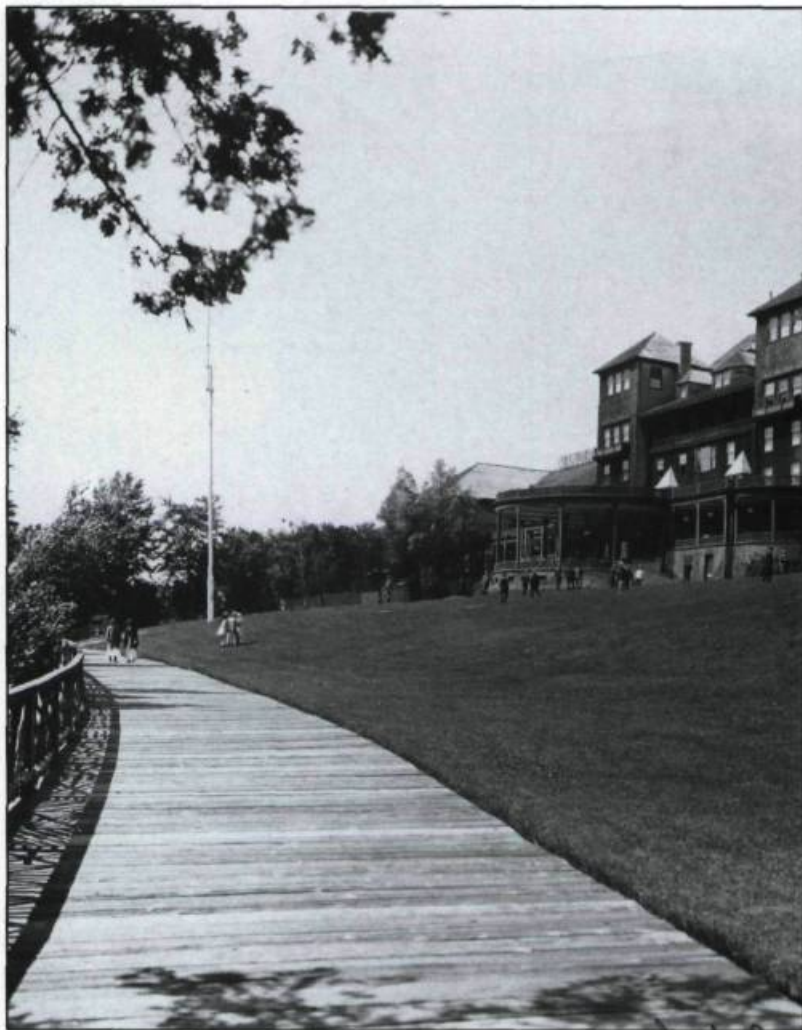
Le premier manoir Richelieu. Cet hôtel luxueux, édifié en 1899, devait être la proie des flammes dans la soirée du 12 septembre 1928. Il sera reconstruit l'année suivante.

Située en périphérie de Québec, Charlevoix connaît aujourd'hui une situation économique et